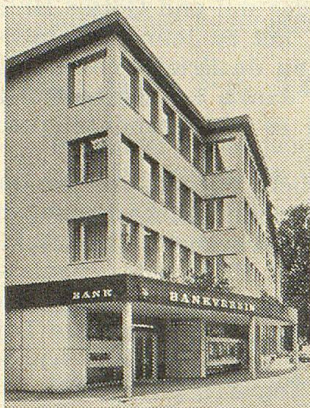
SCHWEIZERISCHER BANKVEREIN Herisau

Vertrauen Sie uns Ihre Ersparnisse an. Eine vorteilhafte Anlage sind z. B. unsere Kassa-Obligationen.