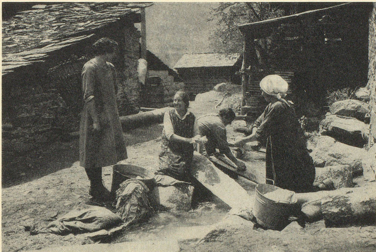
Dorfidyll im Walliser Bergdorf Außerberg. Washtag am Gletscherbach.