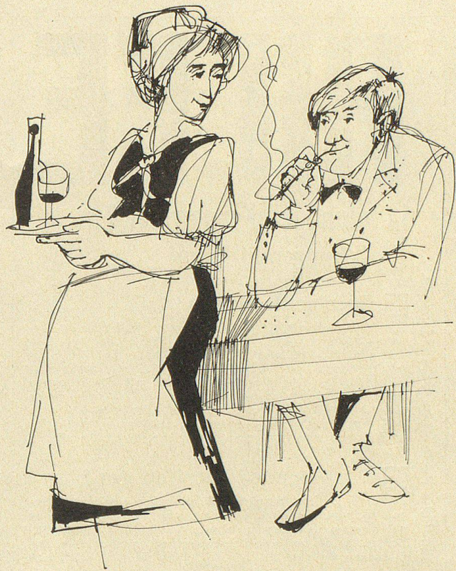
Er paßte auf, wie ein Häftlimacher, wenn Gredig mit der Wirtin plauderte, ob er von dem Gespräch etwas erhaschen könnte —

Das merkt eine Frau meistens bald, ob sie einem Manne gleichgültig ist, oder nicht. Die Pfauenwirtin war darin keine Ausnahme. Wenn sie sah, wie die Augen des Lehrers Zimmerli ihr