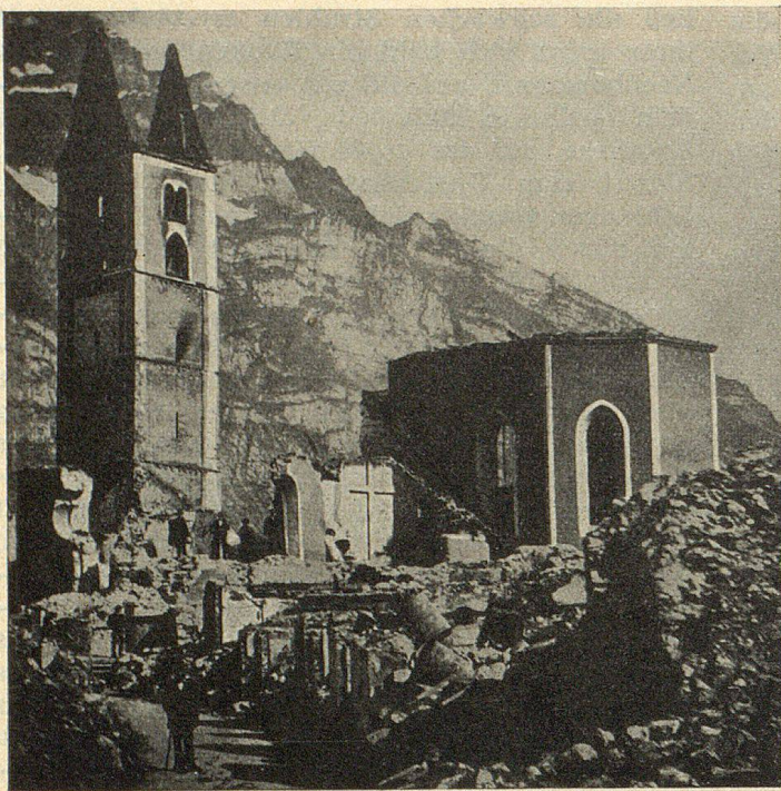
Die Trümmer der 1026 geweihten Kirche

bar — der Südwind für geraume Zeit nachgelassen bzw. sich nach Westen gedreht hatte, um das östliche Pressequartier heimzusuchen. Noch war es nicht Mitternacht, als 500 Wohnhäuser und an die hundert Ökonomiegebäude, Ställe, Schöpfe usw. wie ein einziger riesiger Feuerofen glühten. Längst hatte die Stürmermannschaft die Kirche verlassen müssen, die wie eine riesige Fackel brannte, deren erst wenige Jahre zuvor vollständig erneuertes vierstimmiges Geläute schmolz und zu Boden stürzte. Selbst die hölzernen Grabkreuze auf dem Gottesacker fingen wie zuweilen Häuser einzig durch die fürchterliche Hitze Feuer.