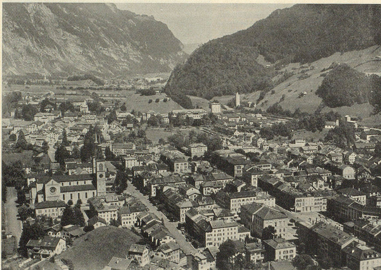
Das wiedererstandene Glarus mit den regelmäßigen Straßenzügen, links die Stadtkirche