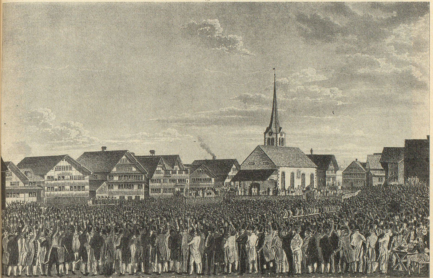
Außerordentliche Landsgemeinde in Hundwil vom 3. März 1833