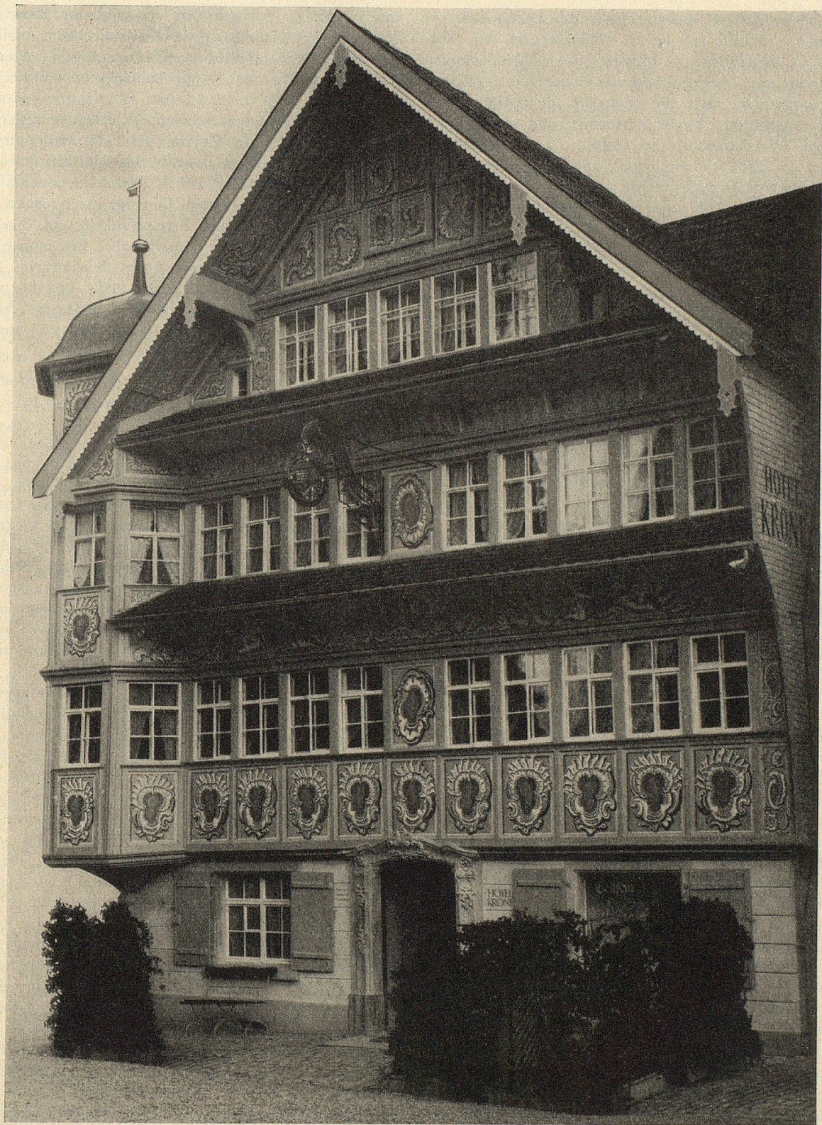
Hotel «Krone», Trogen. Die prächtige Fassadenmalerei wurde von Kunstmaler Walter Vogel, St. Gallen, renoviert