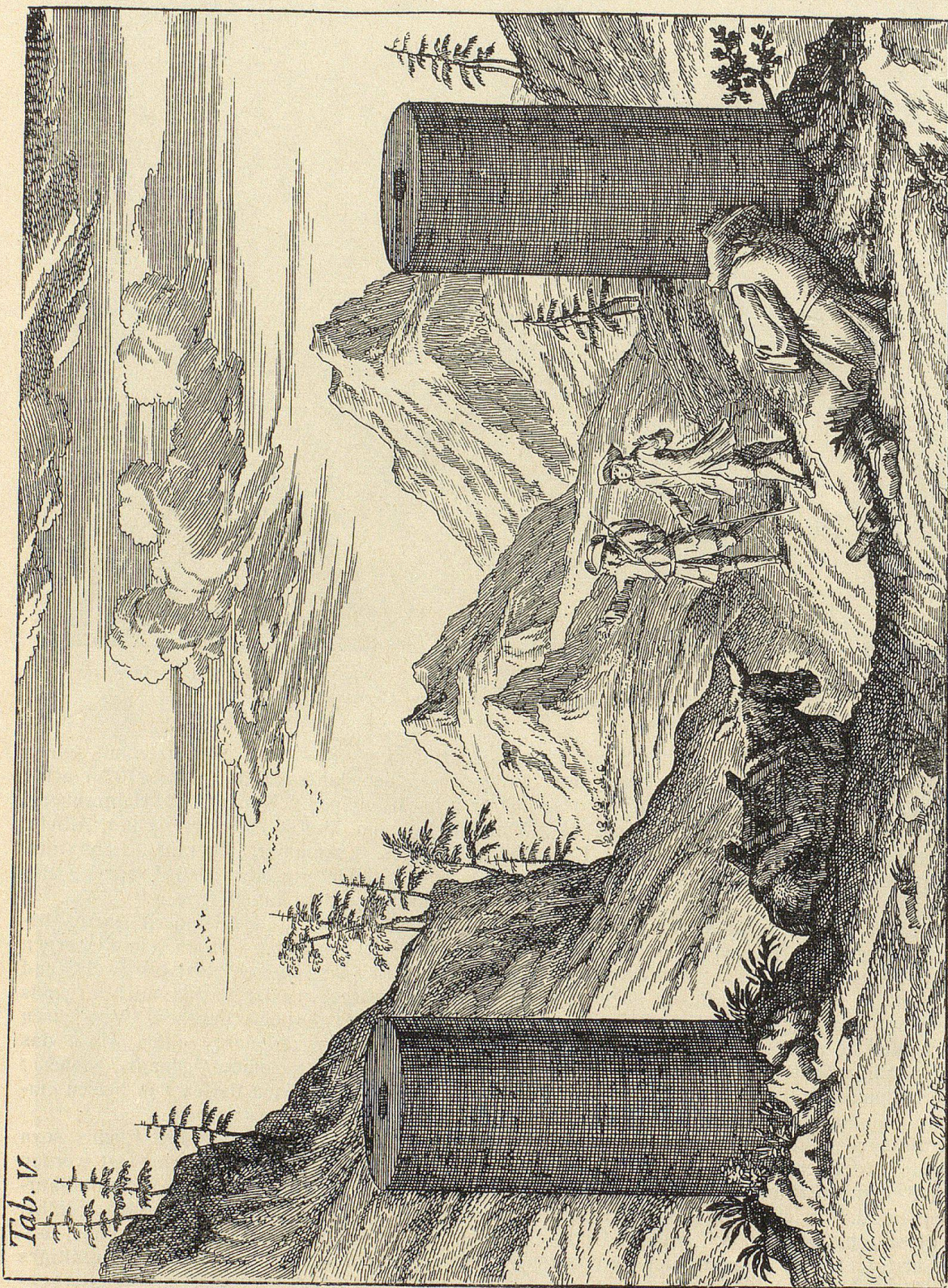
Die alten Säulen auf dem Julierpaß

Aus J. J. Scheuchzers «Natur-Historie des Schweizerlandes», Zürich 1752.