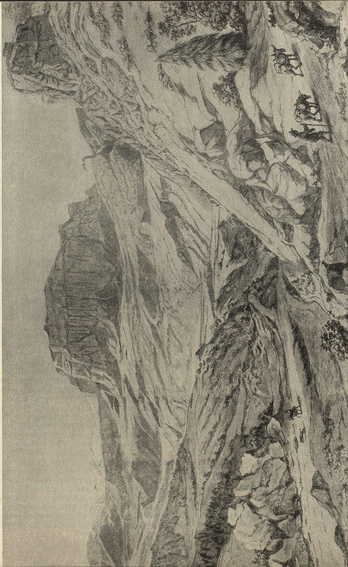
Flimsenstein von Porclas aus gesehen