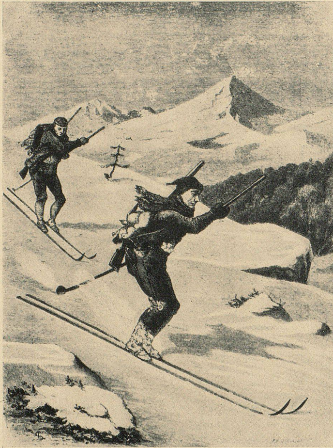
Jäger auf Skiern (Um 1870)

lange Zeit bedenklich schlecht. Das Skifahren beschränkte sich aufs Bergaufsteigen und auf möglichst sturzfreie Schussfahrten. Von Schwüngen wußten unsere Skipioniere so viel wie nichts. Rechtzeitiges Bremsen und Anhalten war deshalb keine einfache Sache. Dem Skistock – man hatte gewöhnlich nur einen – kam unter diesen Umständen größte Bedeutung zu. Er war zwei bis zweieinhalb Meter lang, bestand aus Bambus, und wies unten eine Stahlscheibe auf. Indem man ihn bei der Abfahrt zwischen die Beine klemmte, konnte man das