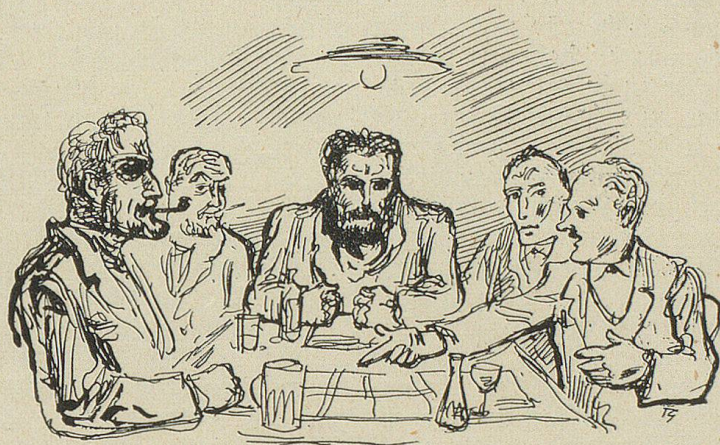
«Im 'Sternen' unten versammelte sich der Gemeinderat zur Beratung»

Genugtuung. Endlich gegen vier Uhr nachmittags fing es richtig zu regnen an. Die Fenster wurden allüberall aufgerissen. Man schaute hinaus in die trübe Landschaft, als ob der Herrgott Gold regnen lassen würde. Es regnete am Tage, es regnete die ganze Nacht hindurch, es regnete auch am folgenden Tage. Man zog hinaus auf die Felder, um die notwendigen Arbeiten zu