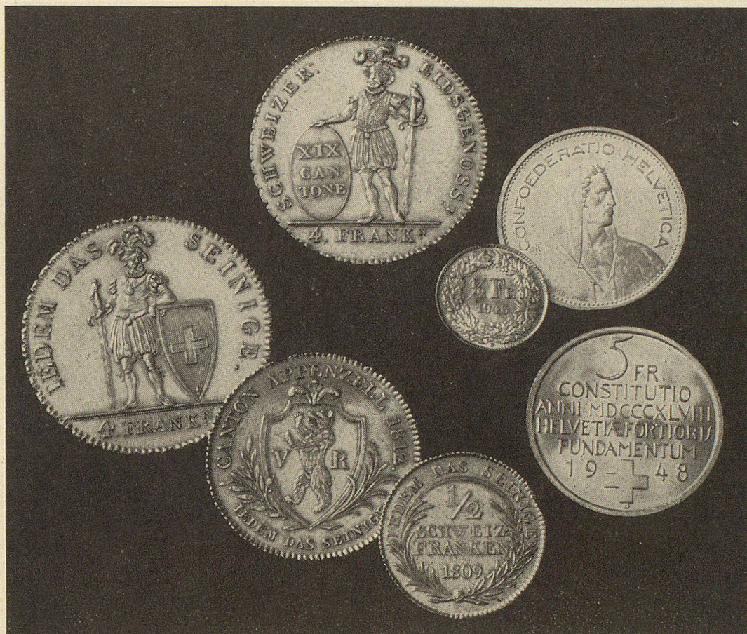
Die Silbersorten: 4 Franken, 2 Franken und ½ Franken. Daneben zum Vergleich Silbermünzen von 1946 und 1948.

Aber die Freude blieb nicht ganz ungetrübt. Da man nämlich beim hier üblichen Elfguldenfuß mit unsern Münzen auf die Schweizerwährung 3½ % gewann, wurde das neue Geld von spekulativen Geschäftsleuten