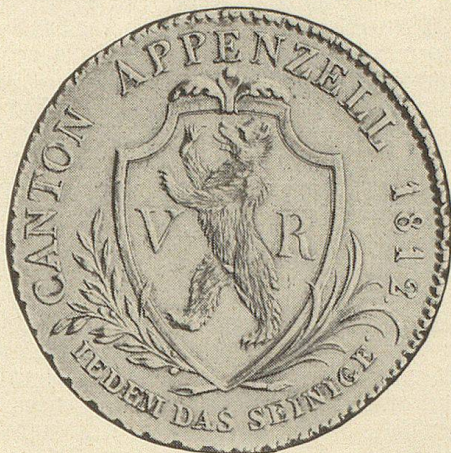
Zweifrankentaler 1812, stark vergrößert