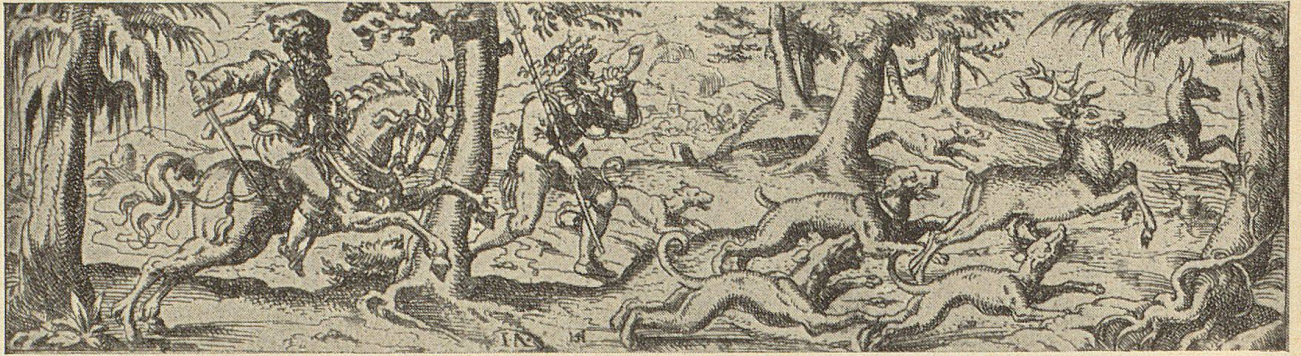
Hetzjagd zu Pferd mit Rüden auf Hirsch und Hinde. Jägerbursche mit Horn «Weydmann».

schwein und der Bärenhund, der Bären und Auer- ochsen stellte, ferner der Windhund für die Hasenjagd und dann der Hirtenhund, Wolfshund genannt, weil er die Herde gegen den Wolf verteidigte, und schließlich der Hofhund. Stehlen und Töten dieser Hunde wurden strenge bestraft. Der Freie übte das Weidwerk vorerst auf seinem eigenen Grund und Boden aus, sei es zu Ernährungszwecken oder zur Vertilgung des Großraub- wilds. Daneben wurde gemeinschaftlich in der der Markt- genossenschaft gehörenden Wäldern, Bergen und All- menden gesagt, sowie auch in den dem König zustehen- den Jagdgründen.