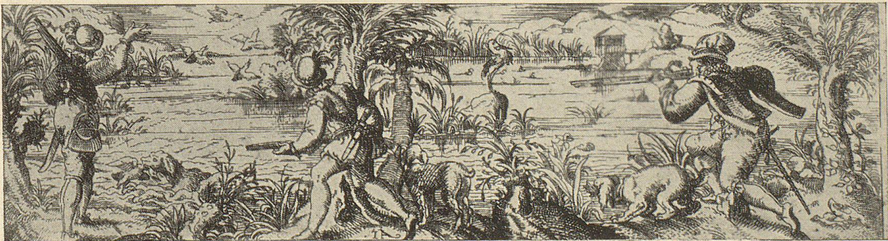
Wasservogeljagd auf Enten und Reiher, Jäger mit Radschloßkarabiner und Niederlaufhunden

Bereits die frühen Volksgesetze, wie die Lex Alamannorum und die Lex Burgundionum, die für das Gebiet der nachmaligen Eidgenossenschaft galten, erwähnen die Jagd und stellen Jagdgesetze auf. Für Unfreie galt jedoch kein Jagdrecht. Von Tieren werden in diesen Gesetzen des 7. Jahrhunderts Wisent, Auerochs, Hirsch, Bär, Rehbock, Reh, Keiler und Wildsau aufgezählt. Als zur „Beizjagd“ abgerichtete Vögel werden Kranich, Falke, „Falknerlei“, und Habicht genannt. Auch die verschiedenen damaligen für die Jagd verwendeten Hunderassen werden aufgezählt, so der Leithund, Treibhund, der Hasenhund für die Hasenjagd, der Saurüde, der Wild-