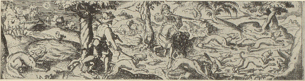
Fuchsjagd, Jäger zu Pferd mit kurzem Radschloßkarabiner und Hatzrüden