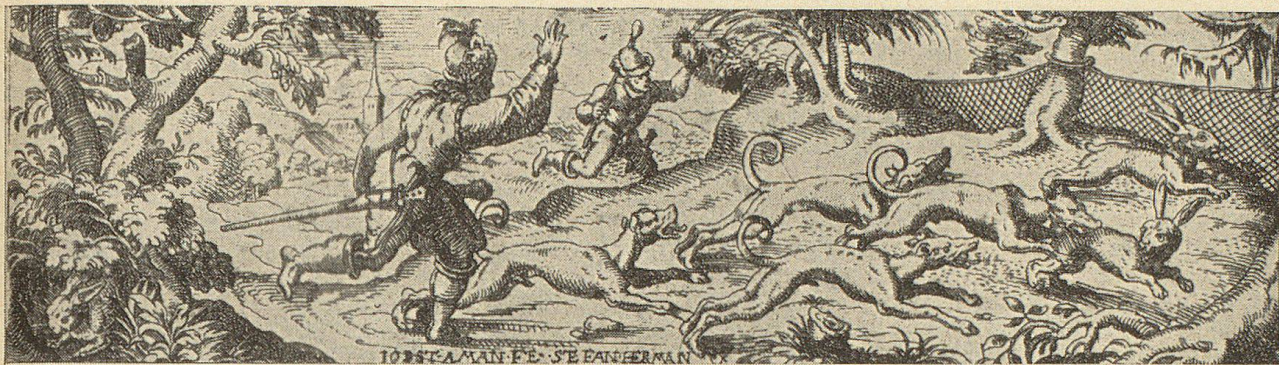
Hasenjagd mit Netz und Hatzruden. Dieses Blatt ist signiert Jost Aman Fe. Stefan Herman ex.

nach Freigabe der Jagd auf, so besonders 1654. In jene Zeit ist das Aufkommen der Revierjagd zu datieren und damit auch das Erscheinen eines eigentlichen Jagdsports mit zahlreichen weidmännischen Regeln. Das "weidgerechte" Jagen kam auf. Das edle "Weidwerk" wurde zu einer Kunst erhoben, die sich allerdings in der Schweiz nicht so entwickeln konnte wie in den umliegenden Ländern auf fürstlicher und monarchischer Grundlage. Immerhin wurde genau geregelt, was außer dem Willbann gejagt werden durfte. Besonders im 17. und dann auch im 18. Jahrhundert wurden von verschiedenen Kantonsregierungen sog. Jägermandate erlassen. Eigene Beamte, die Jägermeister (Jörster und Bannwarte), hatten für die Innehaltung dieser Gesetze zu sorgen und bei verschiedenen Ständen wurden Jagdkommissionen aus den Räten gewählt. Auch sorgte man für eine zeitlich beschränkte Jagd durch Bestimmung einer Schonzeit für einzelne Wildarten (Jagdschutz). Jedermann erlaubt und an manchen Stellen direkt befohlen war das Jagen von wilden Tieren. Das eigentliche Raubwild wurde nach und nach ausgerottet, immerhin erstreckte sich die Wolfsjagd noch tief ins 17. Jahrhundert und die letzten Bären fielen erst zweihundert Jahre später der Kugel des Jägers zum Opfer.