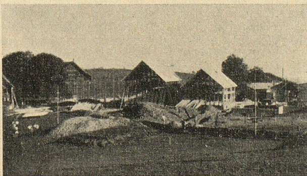
Stand der Bauarbeiten Ende Juli 1946

Um Bau und Finanzierung des Kinderdorfes braucht uns nicht bange zu sein, so lange der Helferwille im Schweizervolk lebt. Es soll ein Eigen- und Gemeinschaftswerk des Schweizervolkes werden, bereits sind verschiedene Aktionen großzügig organisiert worden und waren von schönem Erfolg begleitet, nicht zuletzt durch den freiwilligen Einsatz jugendlicher Arbeitskräfte. Ein solches Werk hilft nicht nur den Notleidenden, es weckt auch in den Helfern edelste und beste Kräfte, die schließlich stark genug sein werden, die Dämonen der Finsternis zu bannen und eine neue bessere Gemeinschaft aufzubauen. Glauben bedeutet stets ein Wagnis; Mißerfolge und Enttäuschungen infolge unserer menschlichen Unzulänglichkeit werden auch hier nicht ausbleiben, allein sie können den nicht abschrecken, der dem Meister nachfolgen will, der sprach: „Lasset die Kindlein zu mir kommen.“