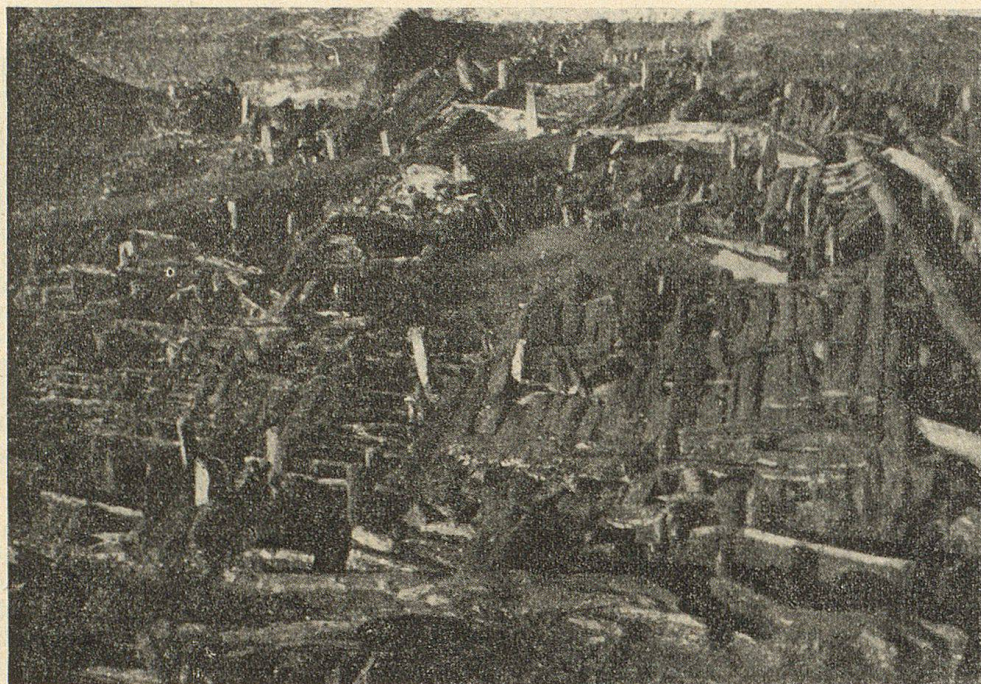
Abb. 1. Blick auf den Rest einer großen Steinzeithütte im Breitenloo bei Pfyn.