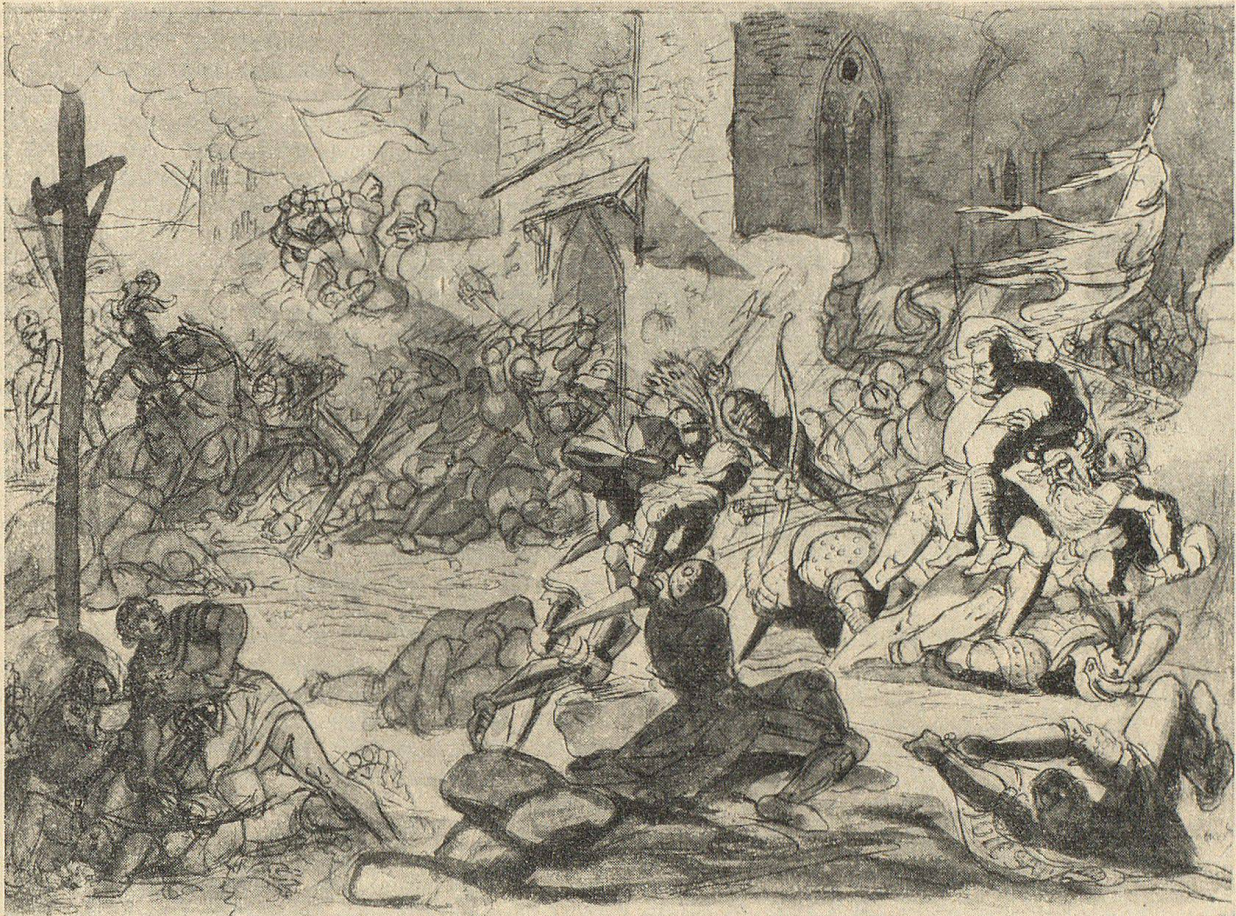
Die Schlacht von St. Jakob an der Aare 1444. Lavirte Federzeichnung von Martin Disteli. Original im Basler Kupferstich-Kabinett.

dessen Hauptereignisse die furchtbare Verwüstung der zürcherischen Landschaft und die Schlacht bei St. Jakob unter den Toren Zürichs mit dem Tode der beiden Unheilstifter Stüssi und Graf waren, endet in einem faulen Frieden. Die Lauheit, mit der die österreichische Ritterschaft Zürich unterstützte, die ständigen Reibungen der Führer mit den einheimischen Behörden hatten in der Stadt eine gewisse Ernüchterung hervorgerufen. So schien der Zeitpunkt zu Unterhandlungen gekommen, die am 24. März 1444 zu Baden ihren Anfang nahmen. Sie waren von den Eidgenossen, von den Bischöfen von Basel und Konstanz, den Fürsten von Württemberg und Savoyen, den österreichischen Ritterschaften und Städten in Schwaben und am Rheine, sowie von 20 Reichsstädten, darunter Augsburg, Nürnberg und Straßburg beschickt, ein Beweis, welch große Bedeutung man dem Kriege weit über die Grenzen der Eidgenossenschaft beimaß. Die Boten der Zürcher kamen den Vermittlungsbestrebungen in hohem Maße entgegen, waren sogar bereit, den König um Aufhebung des Bündnisses zu bitten und einem eidgenössischen Rechtsbott nach Einsiedeln nach den Bestimmungen des Bundesbriefes zu folgen. Allein alle Vorschläge stießen auf den heftigsten Widerstand der österreichischen Partei. Eine aufgehetzte