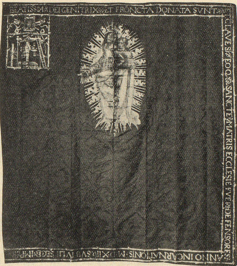
Das „Juliuspanner“, das Papst Julius II. im Jahre 1512 den Schwyzern schenkte.

Rot wie Blut leuchtet das uralte Wahrzeichen des Landes Schwyz in seinen verschiedenen Formen und Größen uns entgegen, den Wandel der Zeiten auch im Außern kündend. Mag vielleicht die pergamentene Beischrift nicht immer stimmen, was tut's? Es sind altehrwürdige Zeugen, die manchen Schlachtensturm erlebt. So gleich das erste und älteste aus rot verblaster Seide, auf die ein Maler des 17. Jahrhunderts zwei Eckquartiere aufmalte, die Madonna und St. Martin mit dem Bettlerweisend. Ein alter Zettel meldet: „825 ward ich getragen gen Rom mit Hilff deren von Ury, Unterwalden und Hasle vnder Margraf Guido Pisterla, die haben Rom wider die Saracenen erret.“ Es soll nach einer alten Ueberlieferung das Panner sein, das König Rudolf von Habsburg 1289 den Schwyzern für