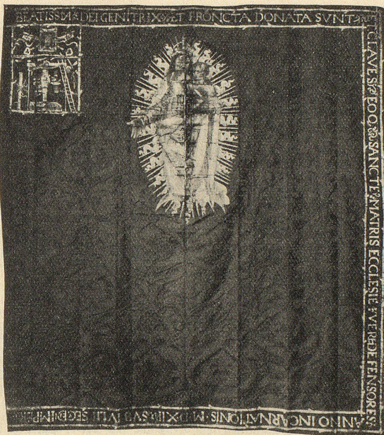
Das „Juliuspanner“, das Papst Julius II. im Jahre 1512 den Schwyzern schenkte.