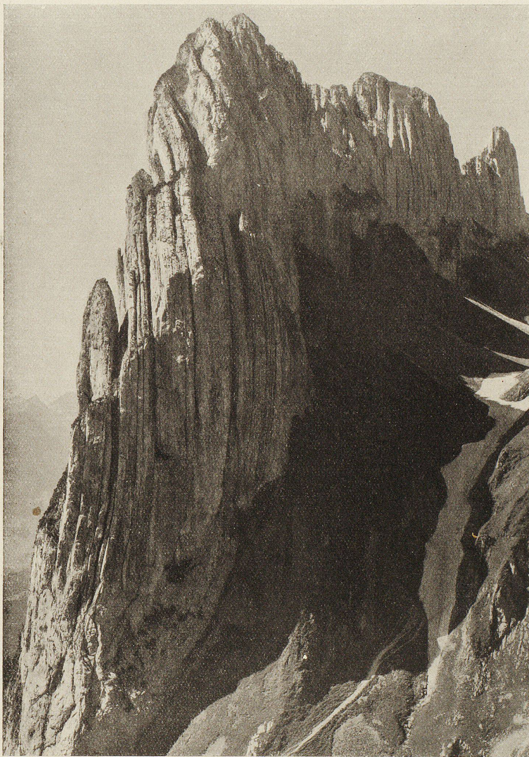
Die Kreuzberge von Dñen.