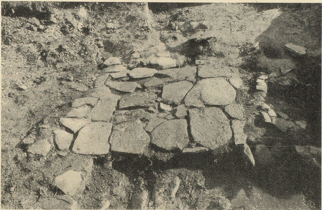
Eine viereckige Herdstelle bestehend aus sorgfältig gelegten Steinplatten. Die Löcher im Boden (rechts oben im Bilde) sind entstanden durch das Verfaulen der Hüttenpfähle.

Murmeltier, der Steinbock und die Wildkatze gejagt.