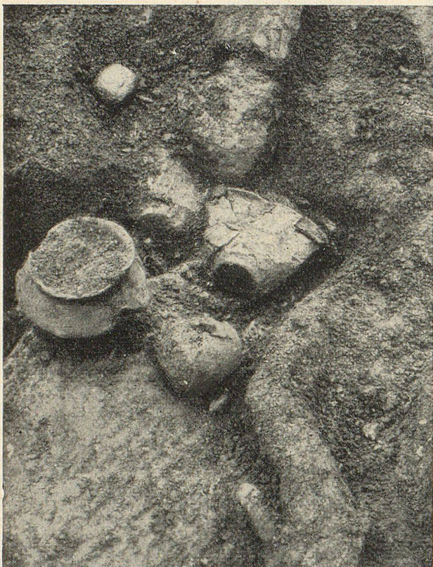
Eine Gruppe von Gefäßen, rechts unten Teil eines Holzbodens.

passen. Man könnte das so deuten, daß einst die schlesischen Bronzezeitleute einen Stamm auf die Wanderung geschickt hätten, der unterwegs die Verzierung mit den Leisten kennen lernte und mit der so bereicherten Kultur in das bündnerische Alpenland einzog. Wenn es gelingen sollte, das Land kennen