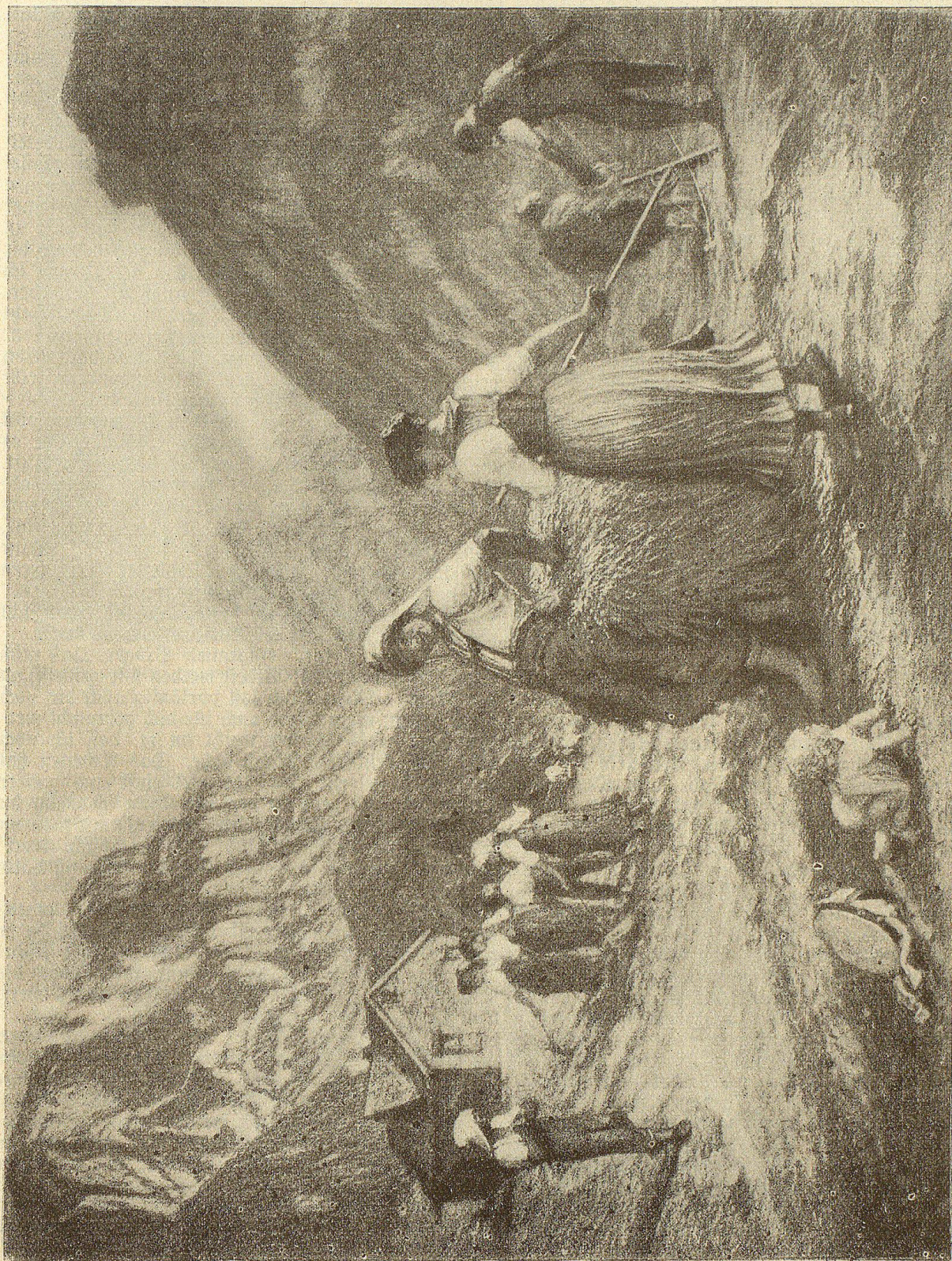
Senernte in den Appenzeller Bergen.