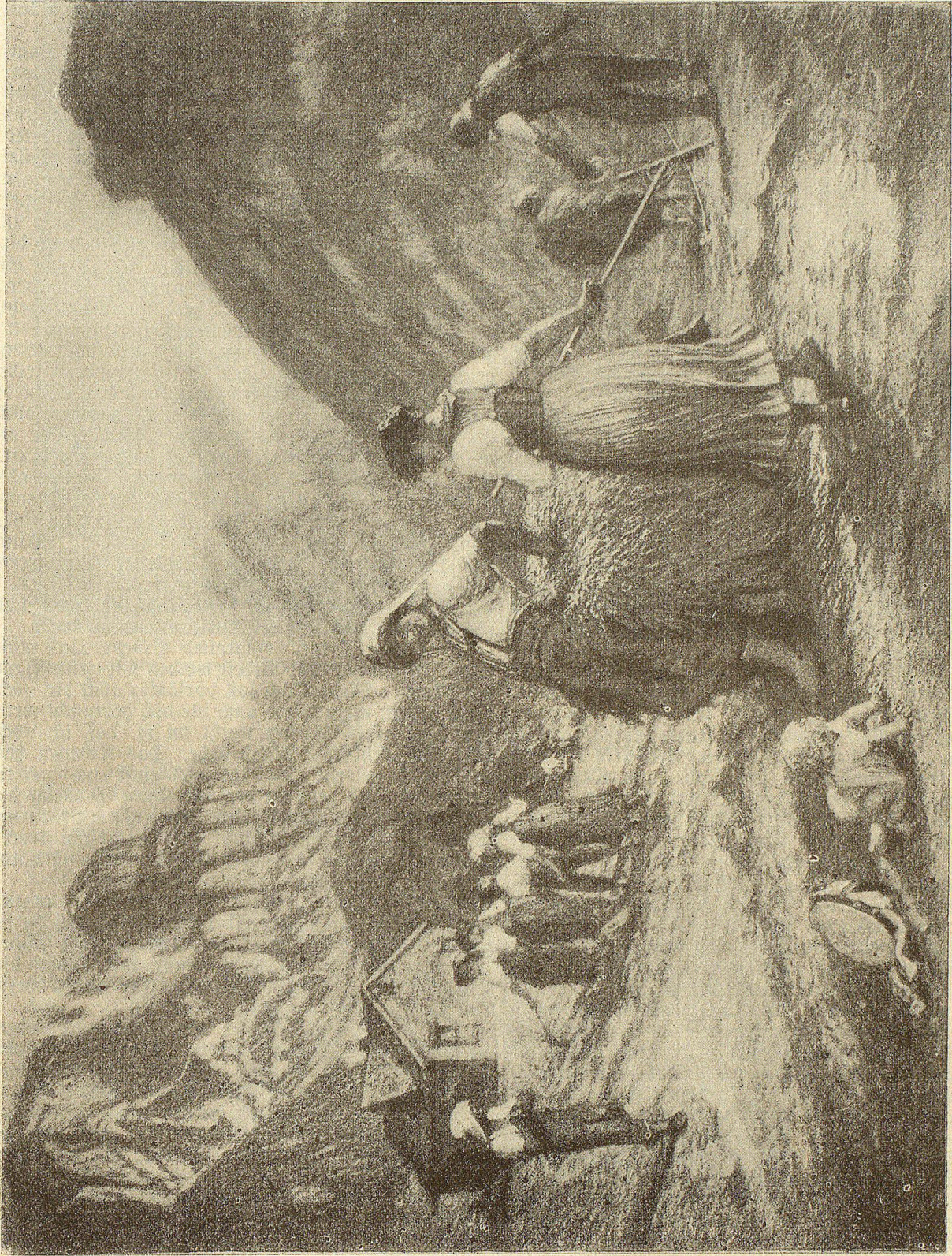
Seenernte in den Appenzeller Bergen.