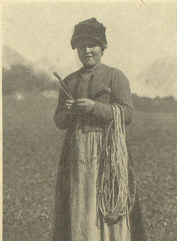
Löttschentalermädchen beim Strohflechten

„Das ist denn keine neumödische Geschichte, die ich da sage — etliche hundert Jahre ist sie alt. Da geschah es zuweilen, daß die Kühe von den Ferdeneralpen, also von Kummern, Resti und Faldum, auf merkwürdige Weise plötzlich verschwanden. Hirten wollten eine Stimme hinter den Kühen gehört haben — ganz furchtbar habe die gerufen: „Loba, loba, loba, schwarzi bruni Chua — gang dem Muzlihare zua!“ — Ein unschuldiges Kind hat einmal gesehen, wie die Kühe von Faldum, von einem schwarzen