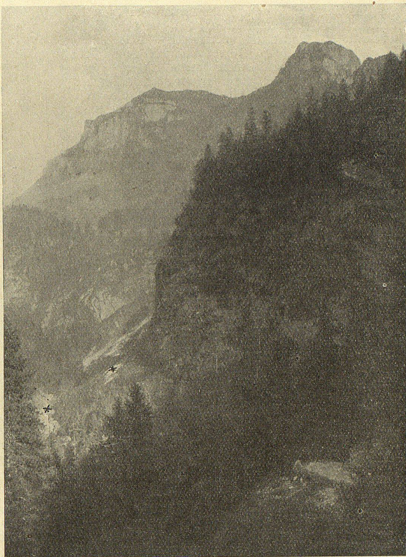
Blick ins Brüeltobel gegen Hoh Kasten und Ramor. (Bei * * der „verhexte Wald“.)

Doch lassen wir die Sage und wenden uns den natürlichen Dingen zu. In unserm Bilde haben wir den Blick von der „Platte“ (Gasthaus „Sämbtiser- see“) auf den Hohkasten (rechts) und den Ramor (links) und ins tiefe Brüeltobel hinunter. Doch zwischen den ** dehnt sich bei 1150 Meter Höhe auf der der Felswand anlehnenen Halde unser ver- wünschter oder verhexter Wald aus, während rings- herum der normalgewachsene Hochwald steht. Auf einer Fläche von etwa 200 Meter Länge und 60—80 Meter Breite auf der 32—38 Grad geneigten Berg- halde erheben sich 1200—1600 der kleinen, oberwärts recht struppig aussehenden Tännchen (Kottannen,