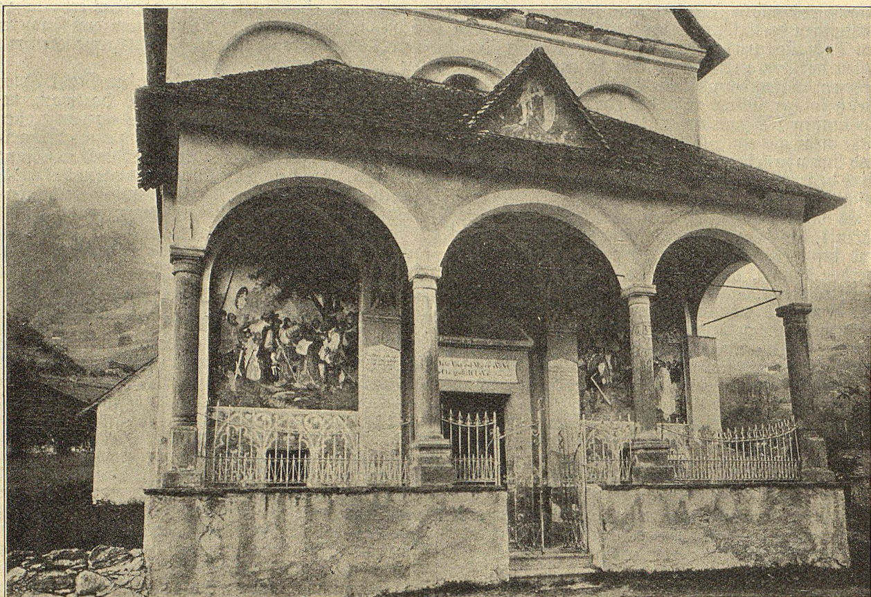
Vorhalle der St. Anna-Kapelle in Truns.

gaben seiner Eigen- und Zinsleute bestand, sich nach einem Rechtszustand sehnte und diesen in einem Vertrag zu finden glaubte, den 1395 der Abt von Disentis, die Gerichtsgemeinde Disentis, der Freiherr Ulrich von Rhazüns und seine Leute, der Freiherr Albrecht von Sax-Misox (damals Besitzer von Belmont) und die Thalleute im Lugnez zu gegenseitigem Rechtsschutz abschlossen, wodurch sie sich zusicherten, daß „jeder Herr und jeder Mann bei seinem Recht belassen werde“, daß auch „jeder sich seines Rechtes begnügen soll“ und daß man jedem „zu seinem Recht verhelfen“ wolle und gegenseitig „von einander Recht nehmen“ solle. Das war das Bündnis „uf Muntena oberhalb dem Flimbwald“, dem nachher auch Graf Johann von Sargans für seine Feste Löwenberg und Graf Rudolf und Heinrich von Werdenberg als Herren von Hohentrins beitraten.