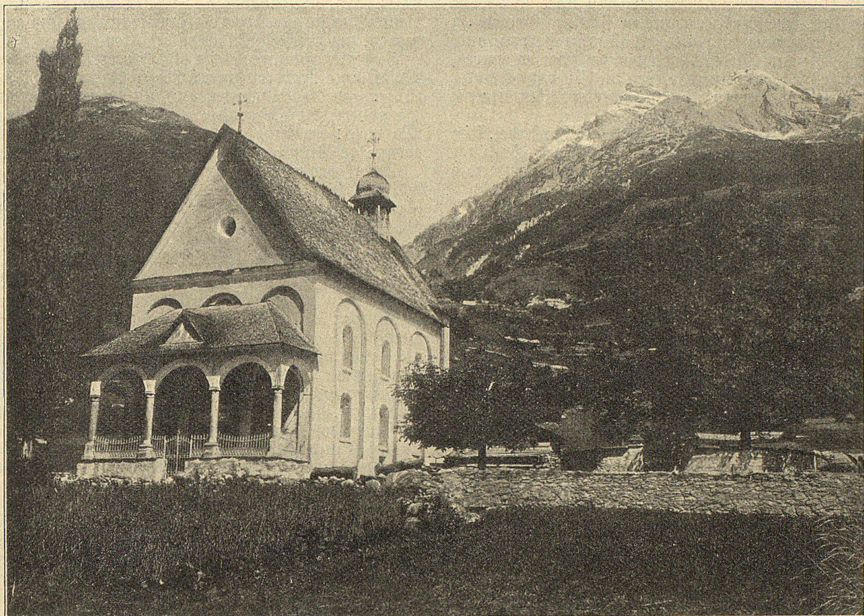
St. Anna-Kapelle in Truns mit dem jungen Rhorn.

Gebietsherrschaft, die vom Staat und König unabhängige Territorialgewalt.