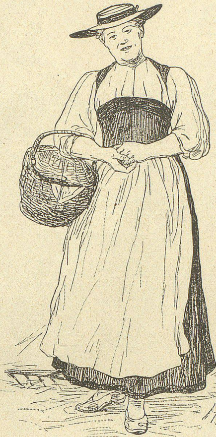
Breneli, Magd auf der Glungge.

Dieser reiche Bauer Hagelhans, der bisher in einem verlorenen Winkel des Emmentales sein Regiment