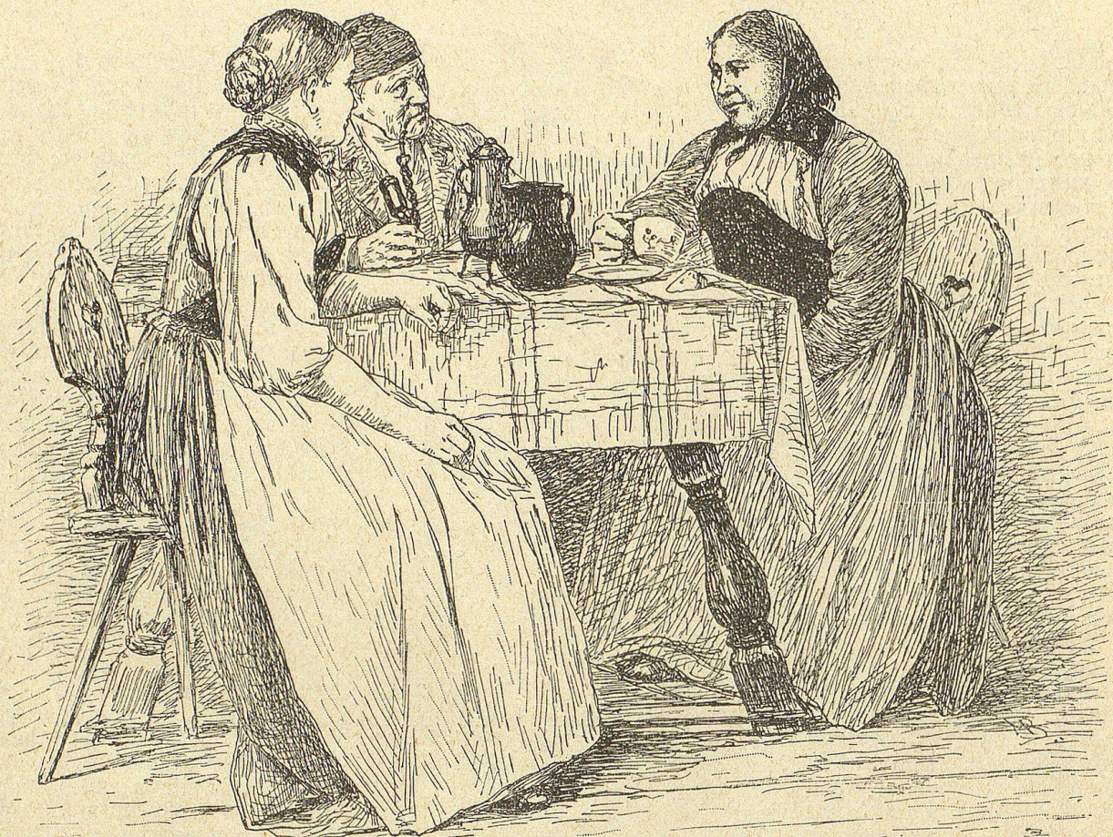
Die Gluggenbäuerin, von einem Besuch aus der Stadt heimkehrend.

uns das prächtige Weib als reiche Bäuerin vorzustellen. Sie wird, aller irdischen Sorgen entledigt, als Gattin, Mutter und Leiterin eines großen Hausstandes ihre Gaben des Herzens zur reichen Entfaltung bringen können. Sie wird der Engel des