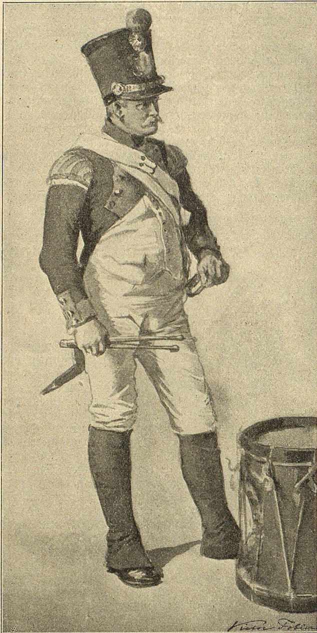
Appenzeller Tambour. Nach einem Aquarell von B. Tobler.

Zeitalter so arg verpönten Haselstock oder gar mit dem „Hagenschwanz“ bearbeiten ließ. Bei aller Strenge im Strafen hatte er jedoch immer nur die Besserung im Auge, und wenn diese sich einstellte, fand er sich zur ehrenvollen Rehabilitation der Betroffenen gern bereit. — Bestechlichkeit, dieses Erbübel der Landvögte der alten Zeit, war ihm fremd, und wehe demjenigen, der sich erkühnt hatte, sich auf solche Art und Weise die Gunst des Landvogts erwerben zu wollen. Deshalb wies er auch alle Geschenke beharrlich ab. Als ihm kurz nach dem Aufzuge in Greifensee ein Untervogt durch seine Frau ein Kalbsviertel aufs Schloß schickte, ließ er derselben eine Flasche Wein bringen