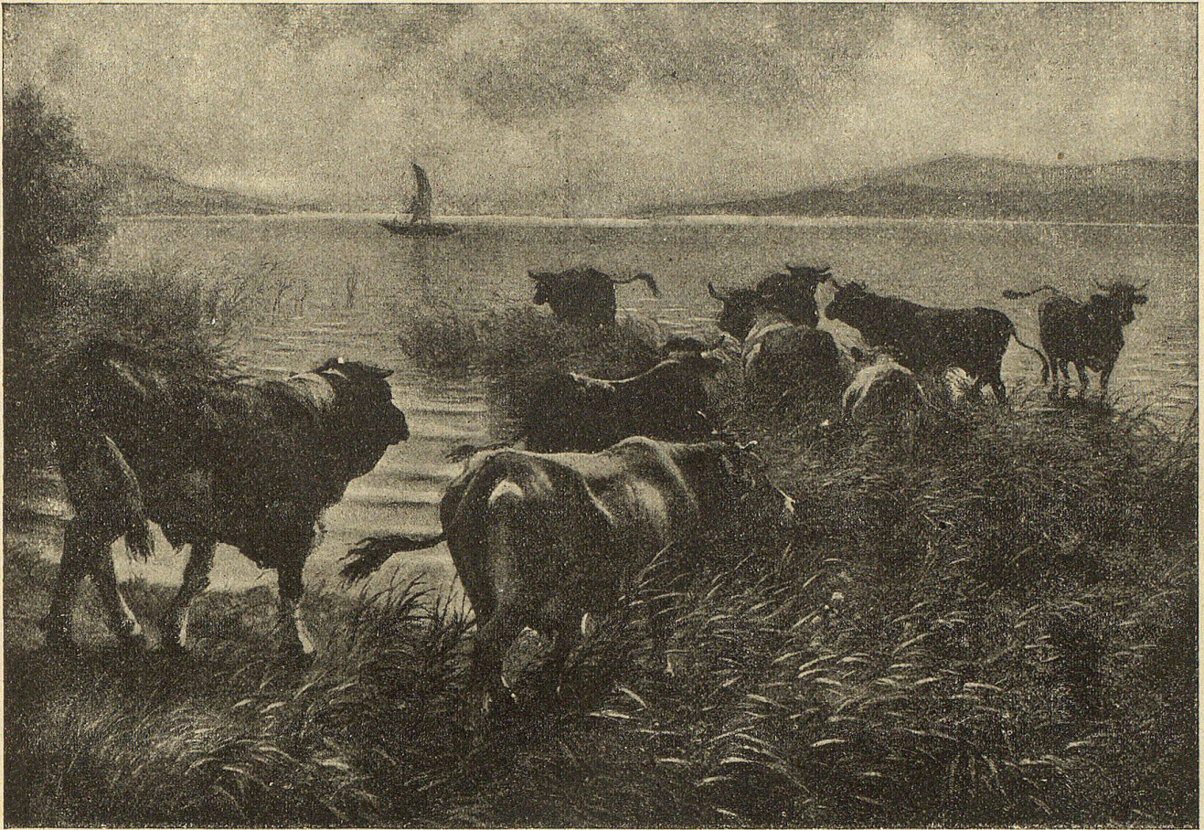
Biehherde am Zürichhorn. Nach einem Gemälde von H. Koller.

im Wirtshaus und läßt es sich auf deine Kosten wohl schmecken; jetzt mag er satt und es an der Zeit sein, für ihn zu bezahlen und den Kerl weiter zu führen." Dies wirkte und von nun an sah man keinen Bettler mehr in Greifensee.