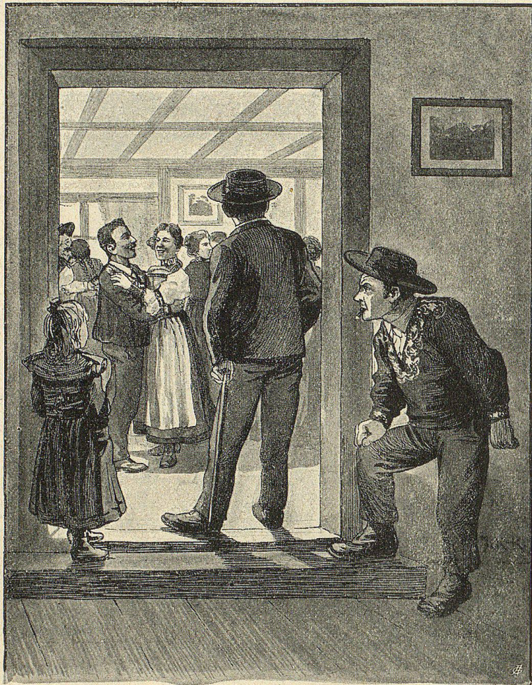
Was trieben sie jetzt da draußen? Es wunderte ihn doch. Dann stand er in die Türschwelle.

„Der Stämpfeler und die Oberschwandenkarline.“ Er hörte es wohl, wie es hinter ihm zischte, als er durch den Gang nach dem Tanzsaal schritt. Seine Augen leuchteten stolz. Die der Karline suchten im Gedränge. „Guten Abend Sepp! Machst denn doch auch einen Tanz mit mir?“ Die Hand, welche eben noch das Schürzenband ordnete, war jetzt frei. Sie sügte sich willig in die schwieligen Finger des Rüttschep.