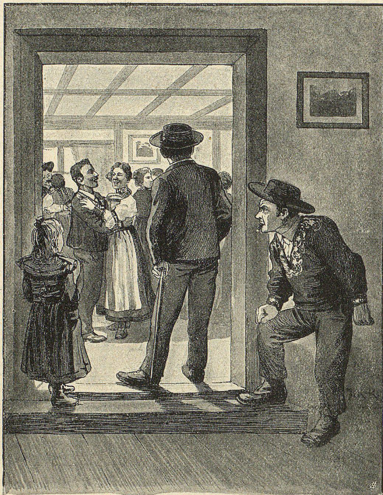
Was trieben sie jetzt da draußen? Es wunderte ihn doch. Dann stand er in die Türschwelle.

„Der Stämpfeler und die Oberschwandenkarline.“ Er hörte es wohl, wie es hinter ihm zischte, als er durch den Gang nach dem Tanzsaal schritt. Seine Augen leuchteten stolz. Die der Karline suchten im Gedränge. „Guten Abend Sepp! Machst denn doch auch einen Tanz mit mir?“ Die Hand, welche eben noch das Schürzenband ordnete, war jetzt frei. Sie fügte sich willig in die schwieligen Finger des Rüttschep.