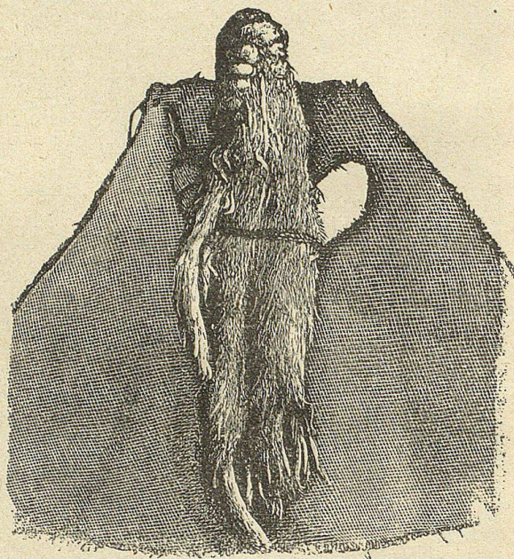
Zwei Alraunwurzeln mit ihren Gewändern aus dem Besitze Kaiser Rudolfs II. (1576—1612).

sorgfältig gepflegt und prächtig gekleidet, Sonnabends in Wasser oder Wein gebadet und sollten dem verschwiegeneu Besitzer Reichthum, Gesundheit und andere irdische Güter, Glück bei Prozessen, Fruchtbarkeit den Frauen und Beförderung der Geburten bringen. Die Charlatane des Mittelalters verkauften sie um hohen Preis. Den meisten Werth hatten die unter dem Galgen gefundenen und von einem schwarzen Hund der Erde entrissenen Männchen. Selbstverständlich ist so ein Alraun nur mit Hilfe des Teufels zu erlangen, denn der Alrun selbst ist ein Stück Teufel und der Besitzer muß seine Seele dem Satan verschreiben. Anders ist die Zubereitung in unserer Gegend. Ein junger Laubfrosch wird beim Vollmond gefangen und unter Anrufung des bösen Geistes mit Hilfe eines Zaubers oder Hexenmeisters unter schmutzigen Ceremonien zum Alrun gemacht. Der glückliche Besitzer setzt denselben in ein verschlossenes Gefäß und hier legt das Zaubertier Tag für Tag ein großes Stück Geld. Sowie aber das Auge