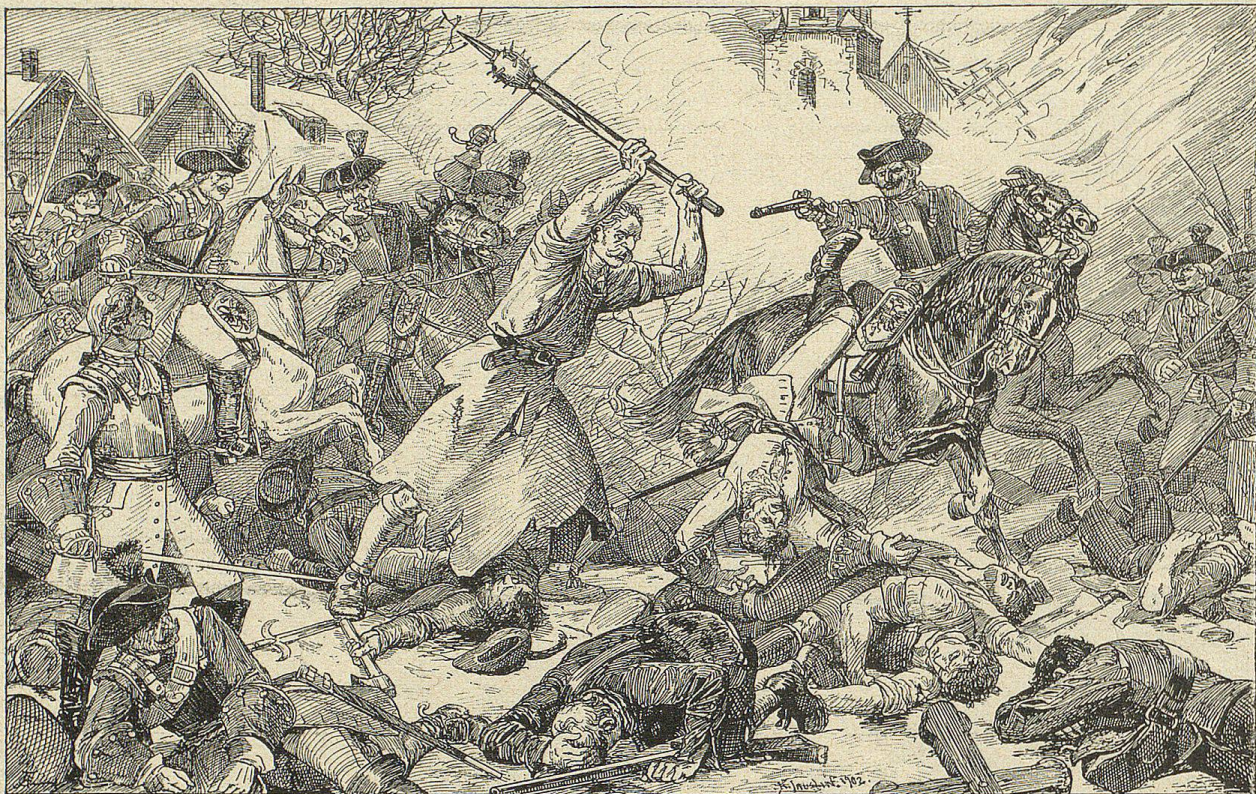
„Hier hast Du Deinen Lohn, alter Schurke und Verräther.“

Aber auch dort war Alles umsonst. Die Kaiserlichen machten einen Ausfall und trieben mit vereinten Kräften die Bauern bis zum Dorfe Sendlingen zurück. Dort, in und um den Kirchhof sammelten sich diese zum letzten Mal. Alte Geschichtsschreiber vergleichen das Schlachtfeld mit einem Rosengarten. Hier auf dem Friedhofe zu Sendlingen blühten am Tage vor Weihnachten die rothen Röslein