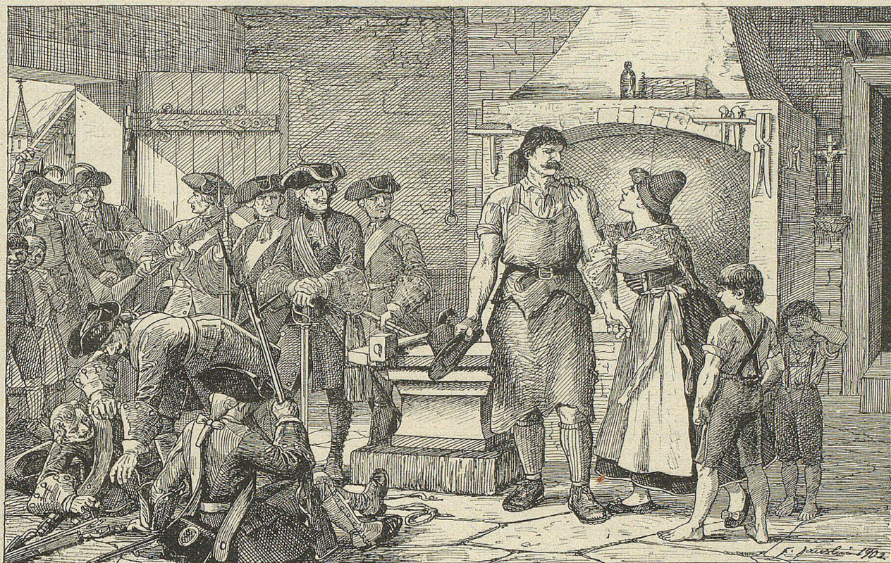
„Tröst' ich Gott unterdessen, spätestens übermorgen bin ich wieder bei Dir und den Buben“, sprach er.

blaue Kinderaugen, hell wie Stahl. Wenn er den Arm erhob mit einer Geberde der befriedigten Kraft, da fühlte man es, daß ihm das leicht von staten ging, was Andere harte, anstrengende Arbeit nannten. Der Schlag seines Hammers durchdröhnte die dörfliche Stille und den Frieden des Moores eine halbe Stunde weit, ähnlich dem Galopp einer sich allmählig annähernden geharnischten Schaar. Das offene Hemd ließ eine raue Brust sehen, deren Seitenrippen bei jedem Zug hervortraten. Er bog sich zurück, nahm einen Schwung und ließ den Hammer niedersausen. Und das ohne Stillstand, mit einem leichten, fortgesetzten Wiegen des Körpers, mit fester Anspannung der Muskeln. Er schmiedete eine Pflugschaar. Tok — tok — tok schallte es.