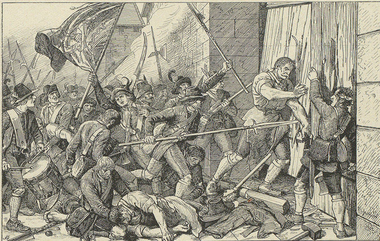
Mit Riesenkraft stemmte sich der Greis gegen den einen Flügel und hob ihn aus den Angeln.

„Den Max Emanuel hat man vertrieben und geächtet, und nun will man auch noch seine Kinder in's Ausland