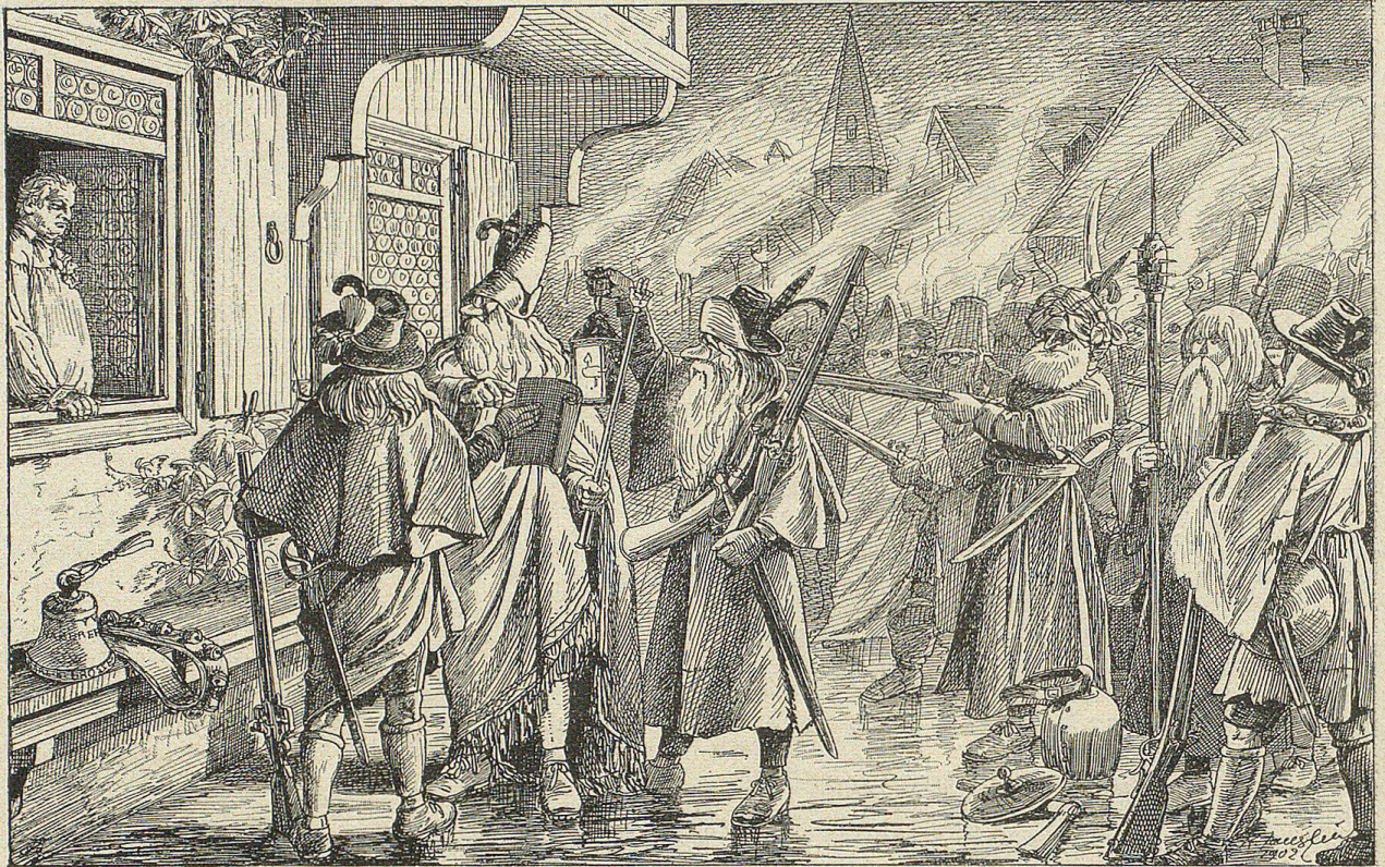
Der Habermeister, den Stab Karls des Großen in der Hand, schritt zum Namensaufruf.

Plötzlich wie auf ein gegebenes Zeichen trat da unten lautlose Stille ein. Der Habermeister, den Stab Karls des Großen in der Hand, schritt zum Namensaufruf. Er war