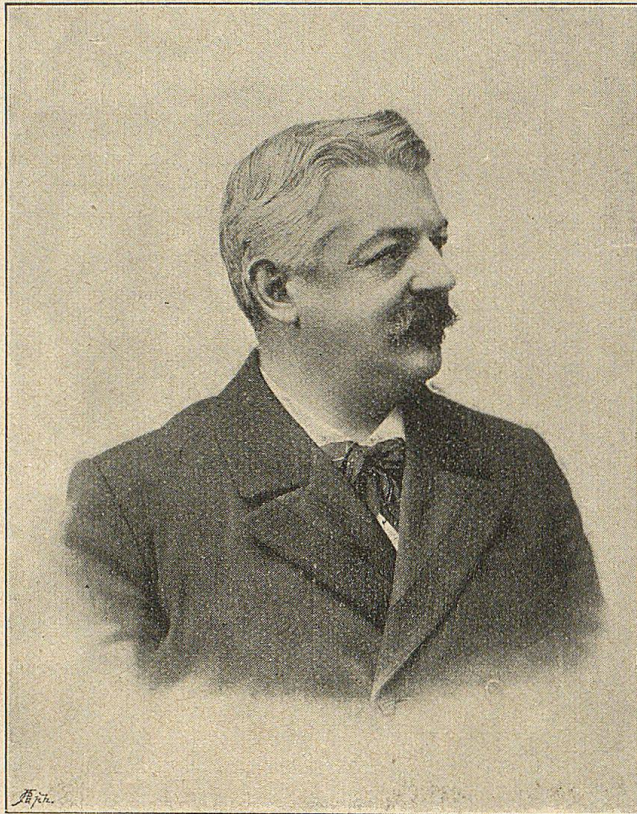
Bundesrath R. Comtesse von La Sagne.

Im inneren Leben der europäischen Staaten haben sich keine besonders wichtigen Ereignisse zugetragen. Frankreich hat seinen Dreifusshandel mit mehr oder weniger Anstand liquidirt. Das Gefühl ist bei unseren westlichen Nachbarn heute allgemein, daß man sich dieser Affaire wegen zu sehr aufgeregt hat, indem Dreifuss die überschwenglichen Sympathien nicht verdiente, die seine Freunde ihm entgegenbrachten, andererseits aber auch der gar so gräßliche Verräther nicht war, zu dem ihn seine Gegner machten, sondern ein recht unsauberer Herr, voilà tout, wie der Franzose sagt. Viel gefährlicher für Frankreich als der