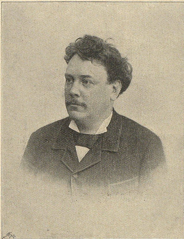
Bundesrath M. Buchet von Ver.

Sitten macht unheimliche Fortschritte. Eine Besserung hofft man durch die Heirath des österreichischen Thronfolgers Franz Ferdinand mit der Gräfin Chotek, einer Dame aus dem böhmischen Hochadel. Dadurch nähert sich ein alter Traum der Böhmen der Erfüllung, einmal eine Frau ihres Stammes auf Oesterreichs Kaiserthron zu sehen. Wenn das Ereigniß eine Aussöhnung mit Böhmen zur Folge hätte, könnte man Oesterreich dazu beglückwünschen, trotzdem alle Hoffschranzen der Welt darüber die Nasen rümpfen. Das schöne Oesterreich! Es hätte sonst alle Vorbedingungen, ein glückliches Land zu sein!