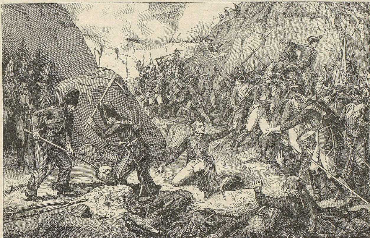
Suvoroff ließ ein Grab für sich graben und rief mit mächtiger Stimme: „Ihr seid nicht mehr meine Kinder, ich will nicht mehr Euer Vater sein; es bleibt mir nichts mehr übrig, als zu sterben, begrabt mich hier!“

Schon vorher hatte ein schwerer Schlag die Ver-