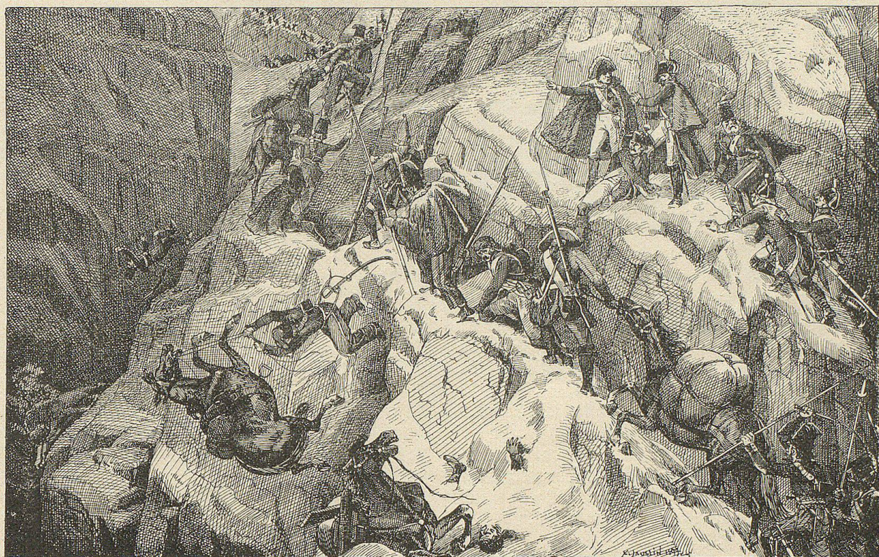
Uebergang der Russen über den Panigepaß.