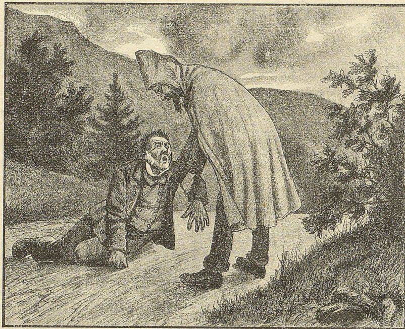
Das Gespenst hat sich über ihn gebeugt. Jetzt packt es ihn am Arm.

Seinen baumlangen, hageren Leib in den schützenden Mantel gehüllt und den treuen „Bakel“, eine Reliquie aus seinen Studentenjahren, unter'm Arm, begab sich der gewissenhafte Arzt unverzüglich auf den Weg, und zwar benützte er, um schnell an's Ziel zu kommen, nicht die Straße, sondern einen Fußweg, der eine große Kurve der letzteren abschneitt.