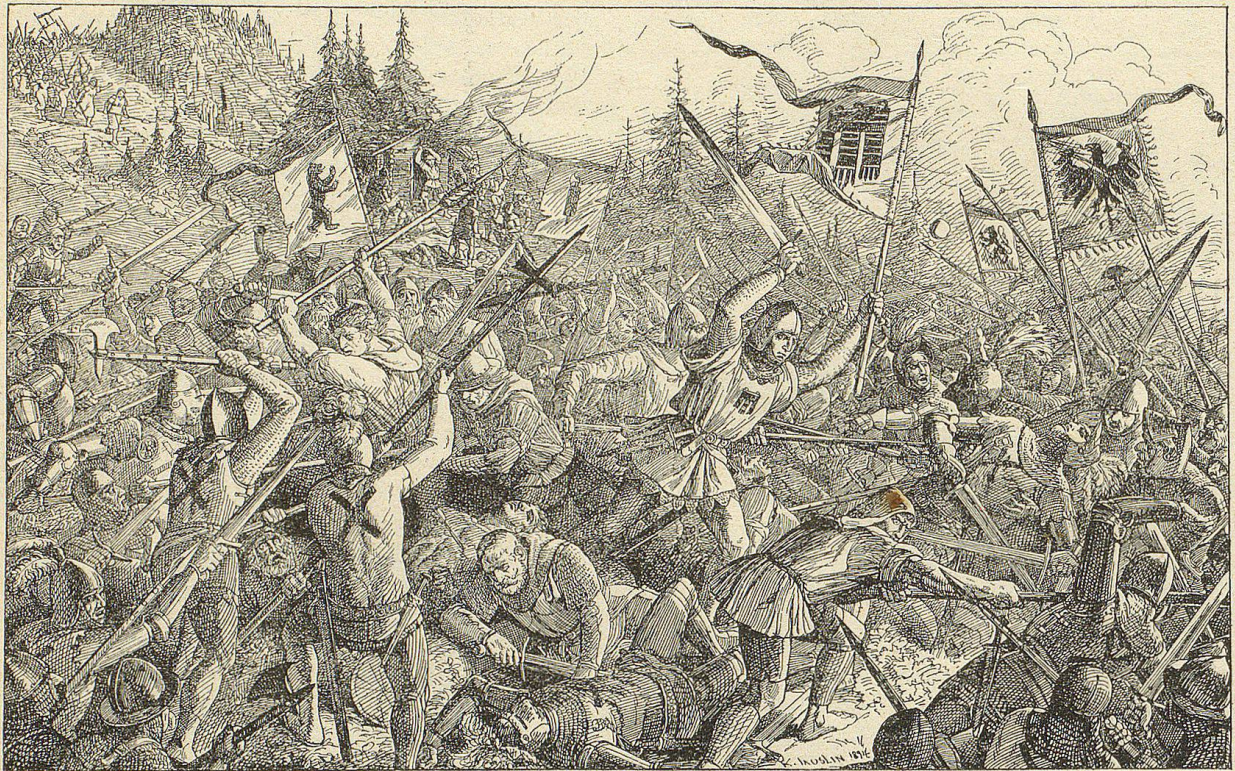
In unaufhaltbarer Wucht stürzten die Frauen mit lautem Geschrei und Gelauchze die Abhänge hinab, dem Schlachtfelde zu.

Mit hochklopfendem Herzen spähte er hinunter, Hohen- und Nieder-Sax zu, über welche der Zug der befreundeten Appenzeller, die ihm die Braut zuführen sollten, herkommen mußte, und der Thürmer fluchte endlich ob seinen ungeduligen Fragen nach dem Zuge und brummte allerlei unehrbares Zeug in seinen struppen Bart.