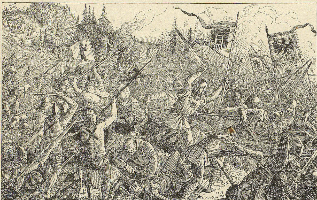
In unaufhaltbarer Wucht stürzten die Frauen mit lautem Geschrei und Gejauchze die Abhänge hinab, dem Schlachtfelde zu.

Mit hochklopfendem Herzen spähte er hinunter, Hohen- und Nieder-Sax zu, über welche der Zug der befreundeten Appenzeller, die ihm die Braut zuführen sollten, herkommen mußte, und der Thürmer fluchte endlich ob seinen ungeduldigen Fragen nach dem Zuge und brummte allerlei unehrbares Zeug in seinen struppen Bart.