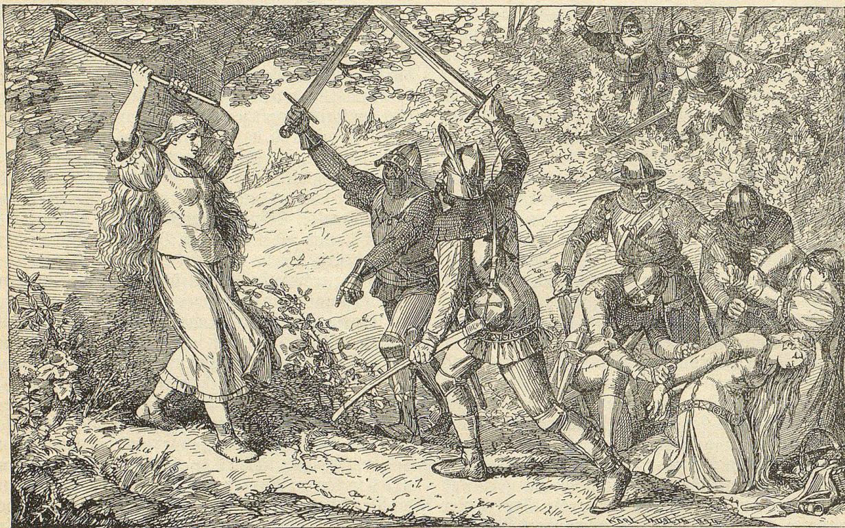
Ein junges, stark gebautes Mädchen in einfacher Appenzeller Tracht wehrte sich mit einem schweren Beilstocke gegen zwei Landsknechte.

Noch einen Blick unsäglichlicher Wuth, gepaart mit höchster Verachtung, warf Hans über das Bild; dann drang sein Feldgeschrei mit unwiderstehlicher Macht in die Ohren der erschreckten Landsknechte, und ehe