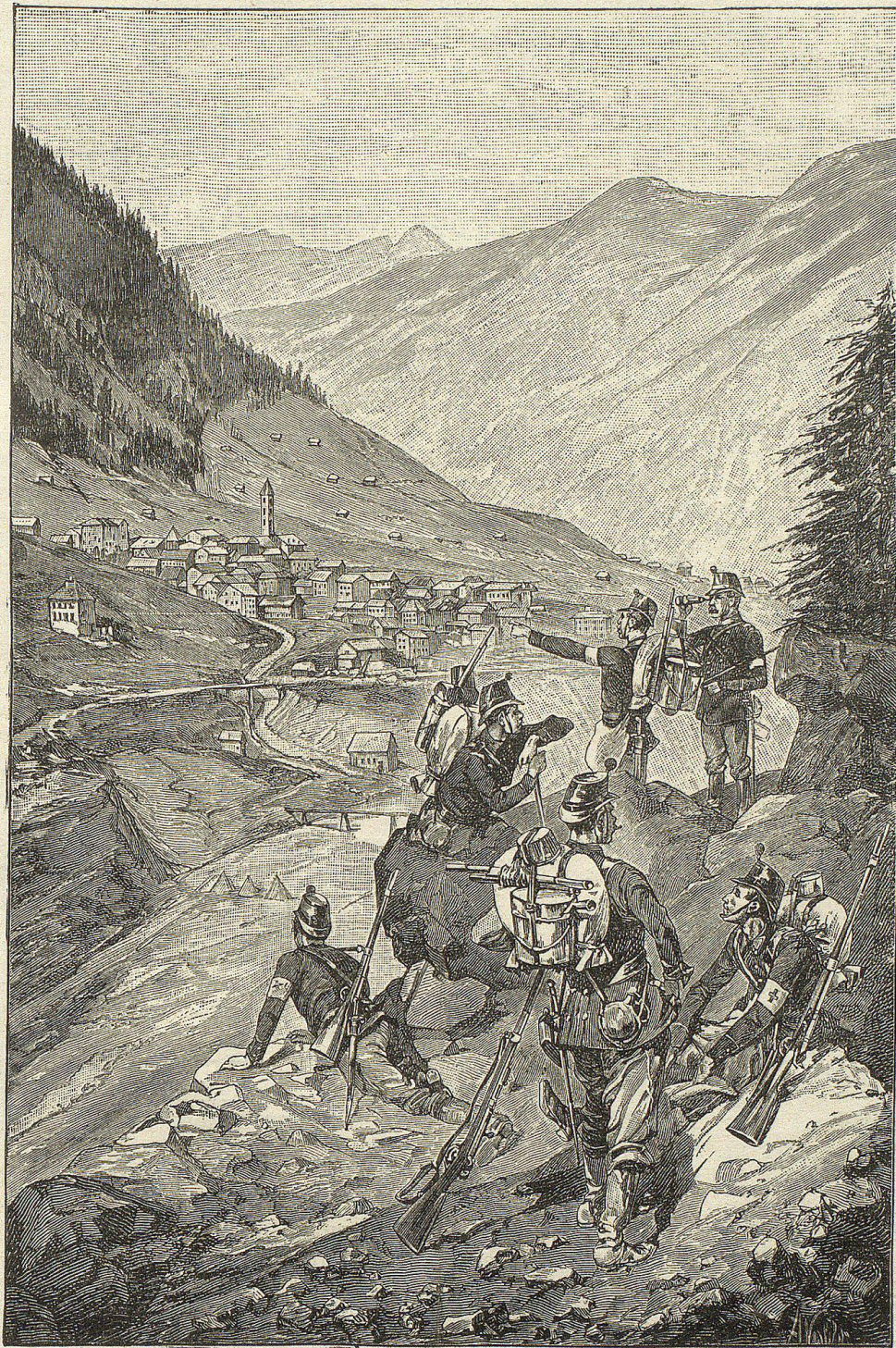
Rekognoszierende Schützen bei Airolo.