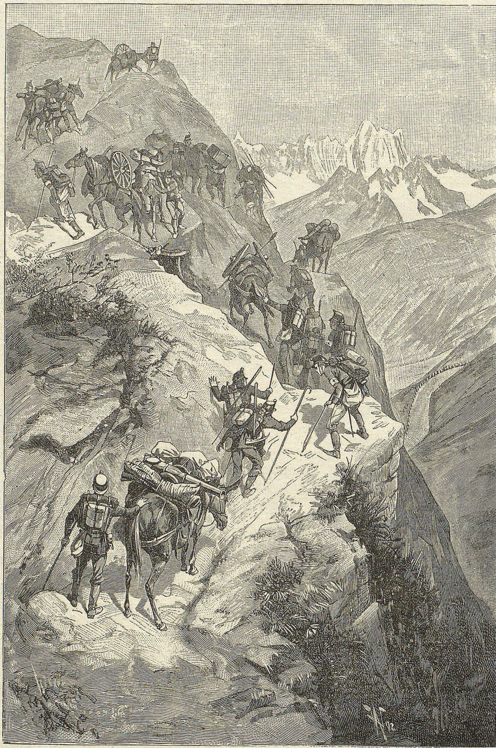
Gebirgsartillerie auf dem Marsch (Blick auf die Furkastraße).