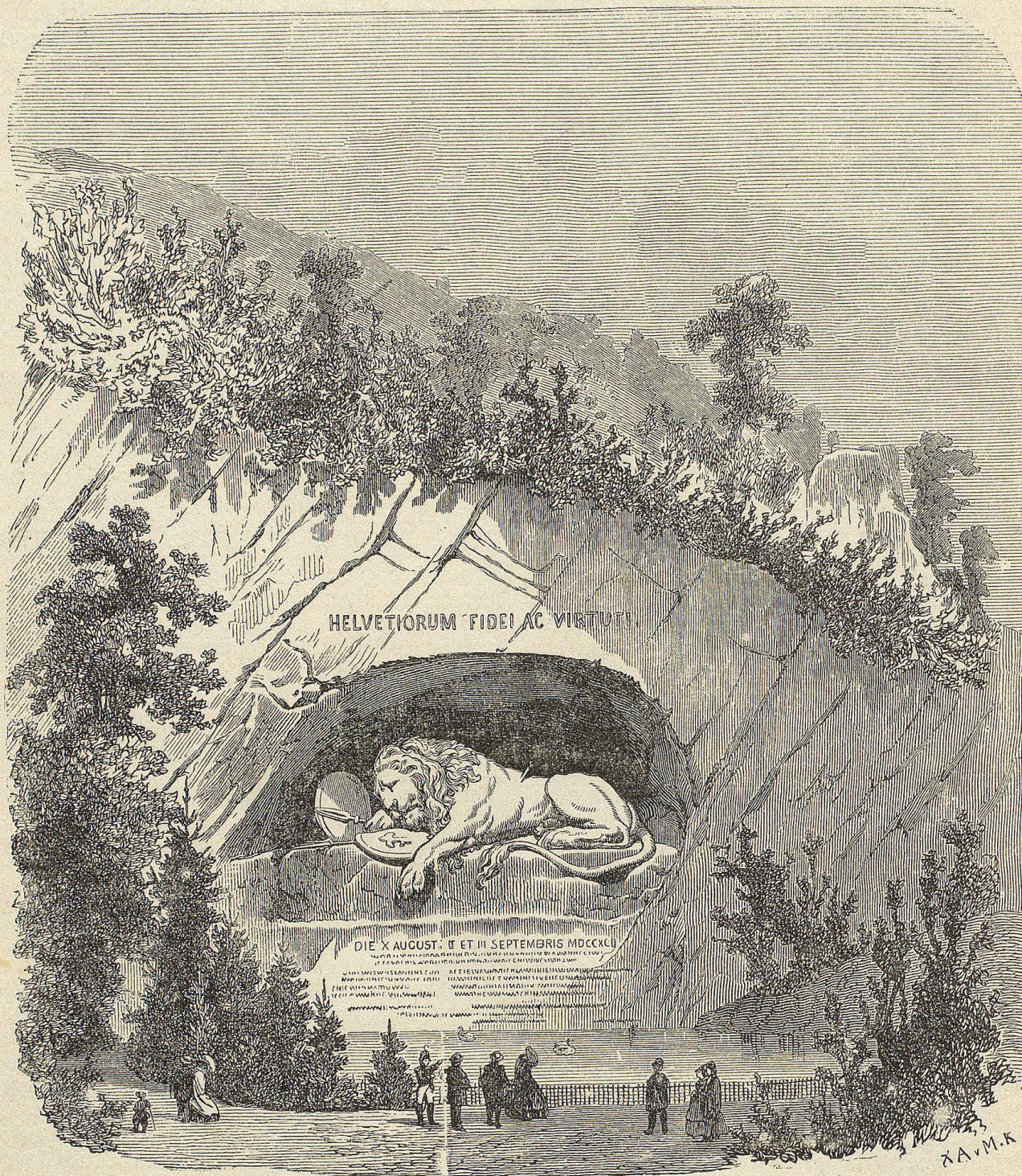
Das Löwendenkmal in Luzern.