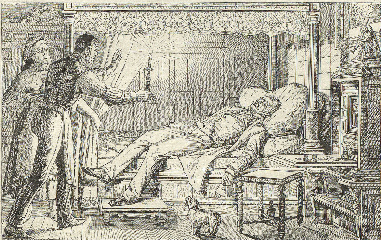
Am gleichen Tage traf ihn der Schlag.