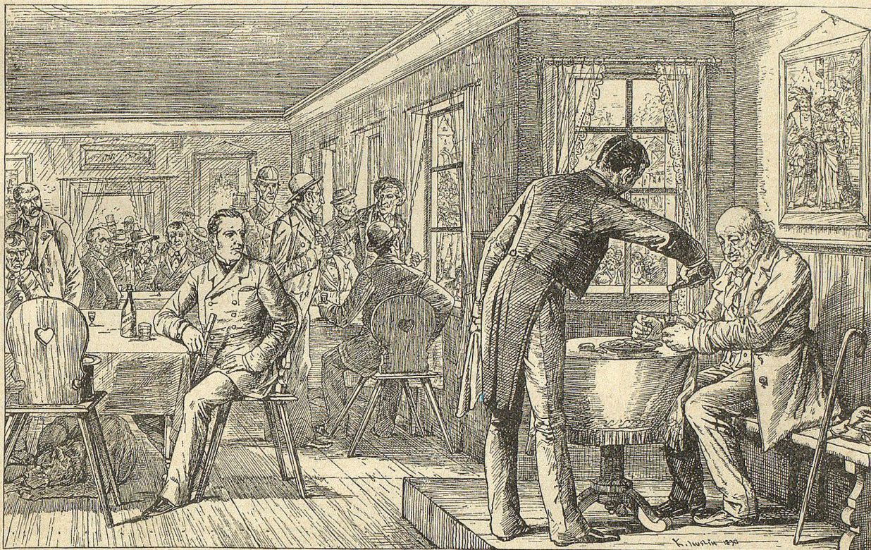
An einem Seitentischchen hatte sich ein Mann niedergelassen, der bald meine ganze Aufmerksamkeit fesselte.

Einer derselben, der in Sagau wohnt, schrieb mir im Jahre 1886: „Ein Todesfall veranlaßt mich, Ihnen unverzüglich zu melden, daß eine der günstigsten Gelegenheiten eingetreten ist, Ihren Antiquitätenschatz zu bereichern. Der alte Gerber ist plötzlich gestorben und wird morgen begraben. Da er weder Nachkommen