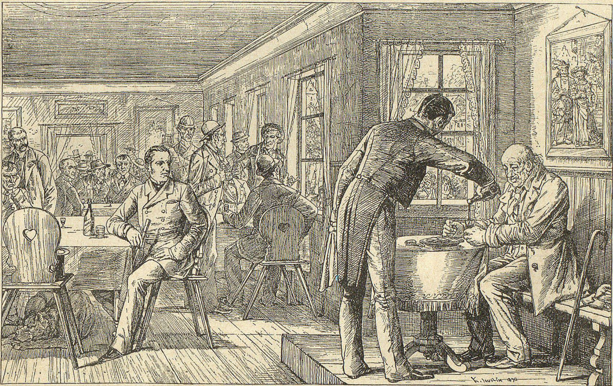
An einem Seitentischchen hatte sich ein Mann niedergelassen, der bald meine ganze Aufmerksamkeit fesselte.

Einer derselben, der in Sagau wohnt, schrieb mir im Jahre 1886: „Ein Todesfall veranlaßt mich, Ihnen unverzüglich zu melden, daß eine der günstigsten Gelegenheiten eingetreten ist, Ihren Antiquitätenschatz zu bereichern. Der alte Gerber ist plötzlich gestorben und wird morgen begraben. Da er weder Nachkommen