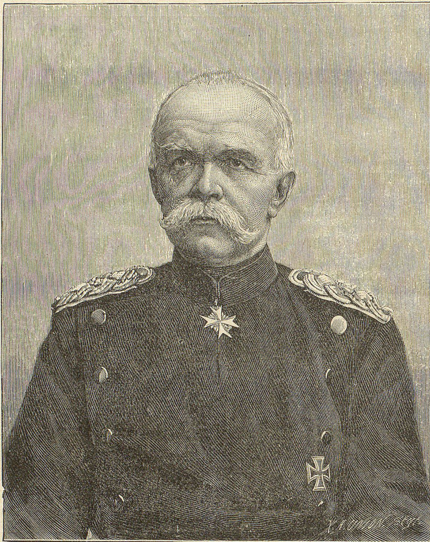
Reichskanzler von Caprivi.

Wenn sonst Bismarck seine Augenbrauen zusammenzog und in Zorn gerieth, so duckte sich Groß und Klein und die Völker fürchteten ein Einschlagen des bösesten Wetters. Der regierende junge Kaiser Wilhelm II. erklärte aber, daß er die erste Geige spielen und sich von Bismarck nicht schulmeistern lassen wolle. Und wie merkwürdig: der mächtigste Staatsmann der Welt ist gefallen und hat nichts mehr zu regieren, die Welt steht aber noch und die Leute leben noch lieber als zuvor und können sich ohne