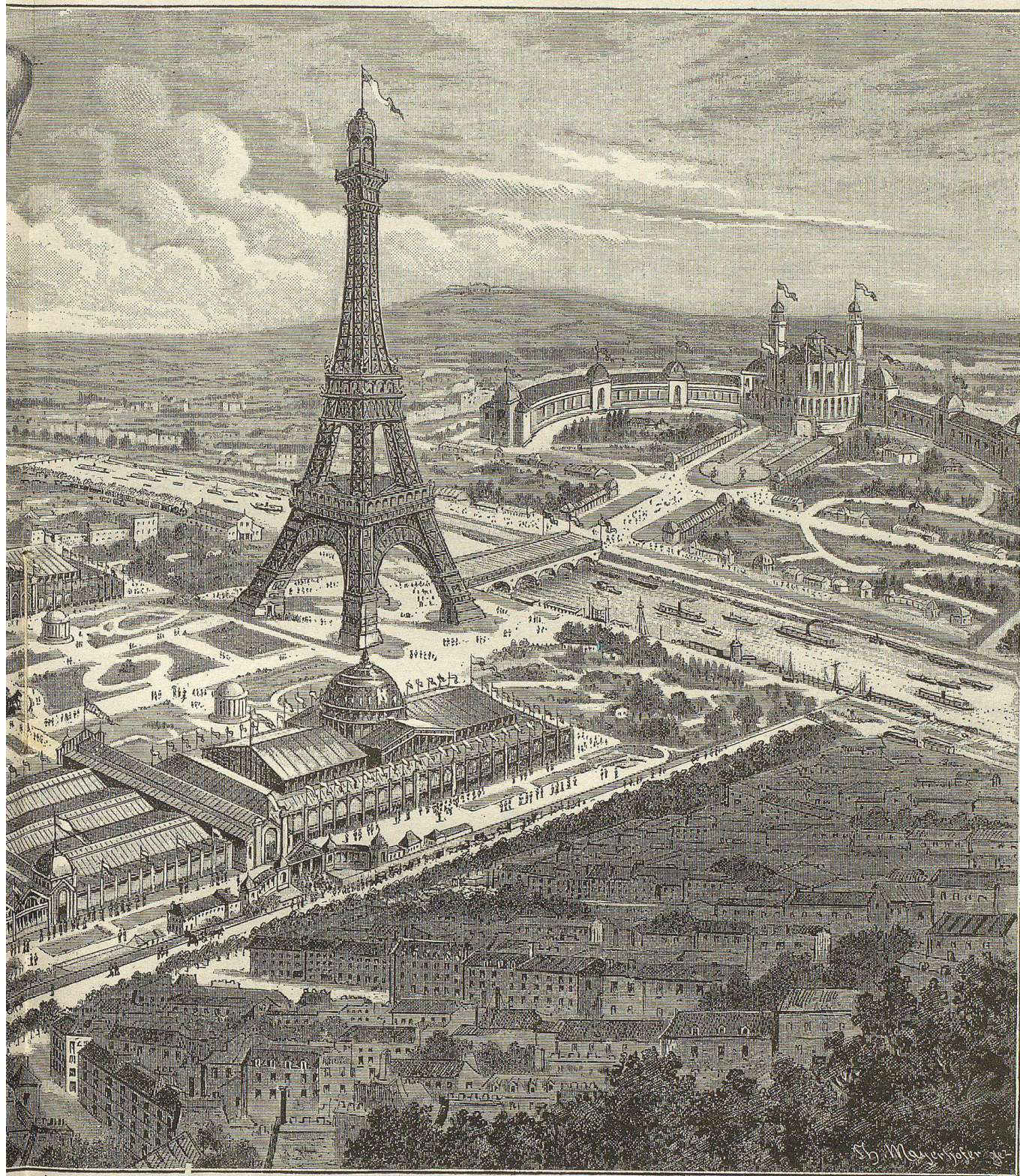
ung in Paris 1839.