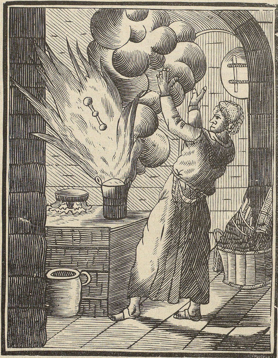
Berthold Schwarz, der Erfinder des Schießpulvers.