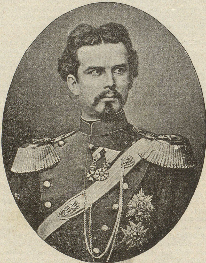
König Ludwig II. von Baiern †.

Griechenland stand Monate lang in Waffen, bereit, von der Türkei ein Stück Land wegzuschrenzen;