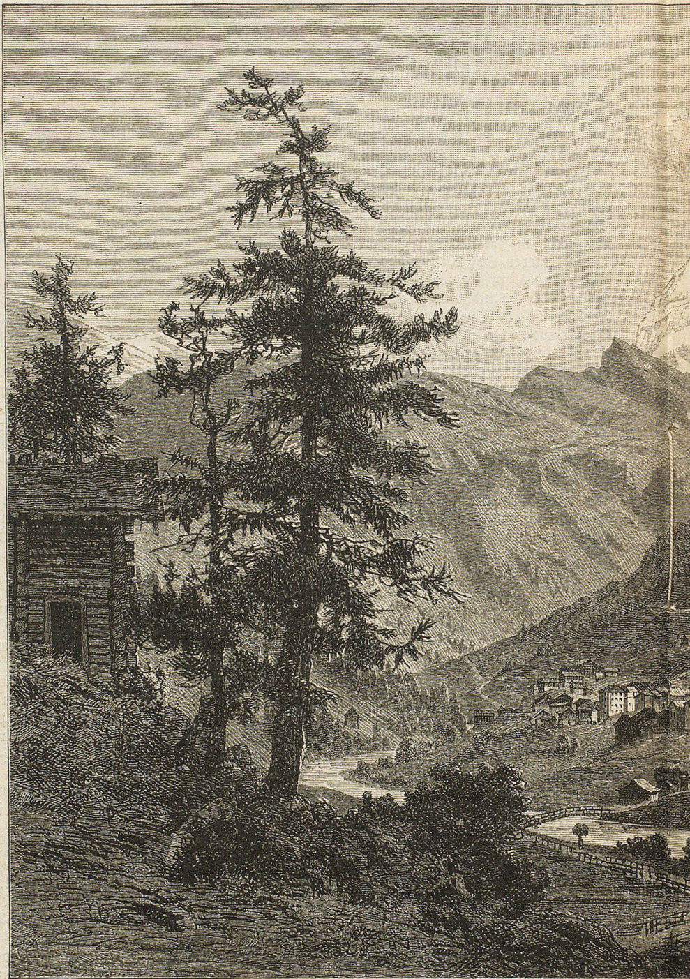
Zermatt im W

Im Jahre 1838 erbaute der Ortsarzt Lauber das erste Gasthaus mit 3 Betten, welche schon im selben Jahre von 10—12 Reisenden benützt wurden. Dieser Zu-