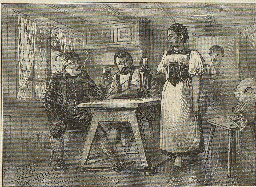
Was mußte der wohl denken, wenn er sein Lieb mit dem reichen, heirathslustigen Wittmann so vertraulich thun sah?

zogen und könnet Euer Muß und Brod selbst verdienen, wenn's mir schon, besonders um Dich, in dieser Beziehung tiefen Kummer verursacht. Nein Lina, Du sollst schließlich Deinen eigenen Willen haben, so sehr der Frik drängen und bringen mag. Aber jetzt komm einewäg herunter und mache wenigstens Gesundheit mit ihm; denn gerade extra vor den Kopf zu stoßen mit Deinem Eigensinn, das brauchst Du den empfindlichen Feldbergbauer doch nicht; wir dürfen nicht ver-