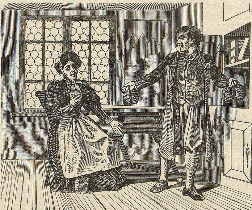
Babe, da brauchts kein Bitten; mit diesen Helfershelfern halt ich zehn Schmidhans aus.

Der Better aber öffnete sein Wandkästlein und nahm einen vollen Beutel um den andern hervor, stellte sie mit Geräusch wieder hin und: "Babe, sagte er, da brauchts kein Bitten; mit diesen Helfershelfern halt ich zehn Schmidhans aus, wenn's drauf ankommt."