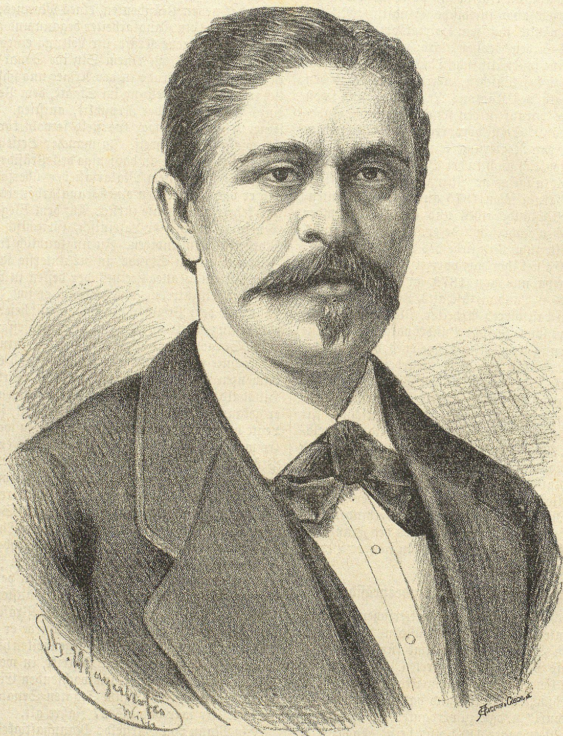
Numa Droz, Schweizerischer Bundespräsident.