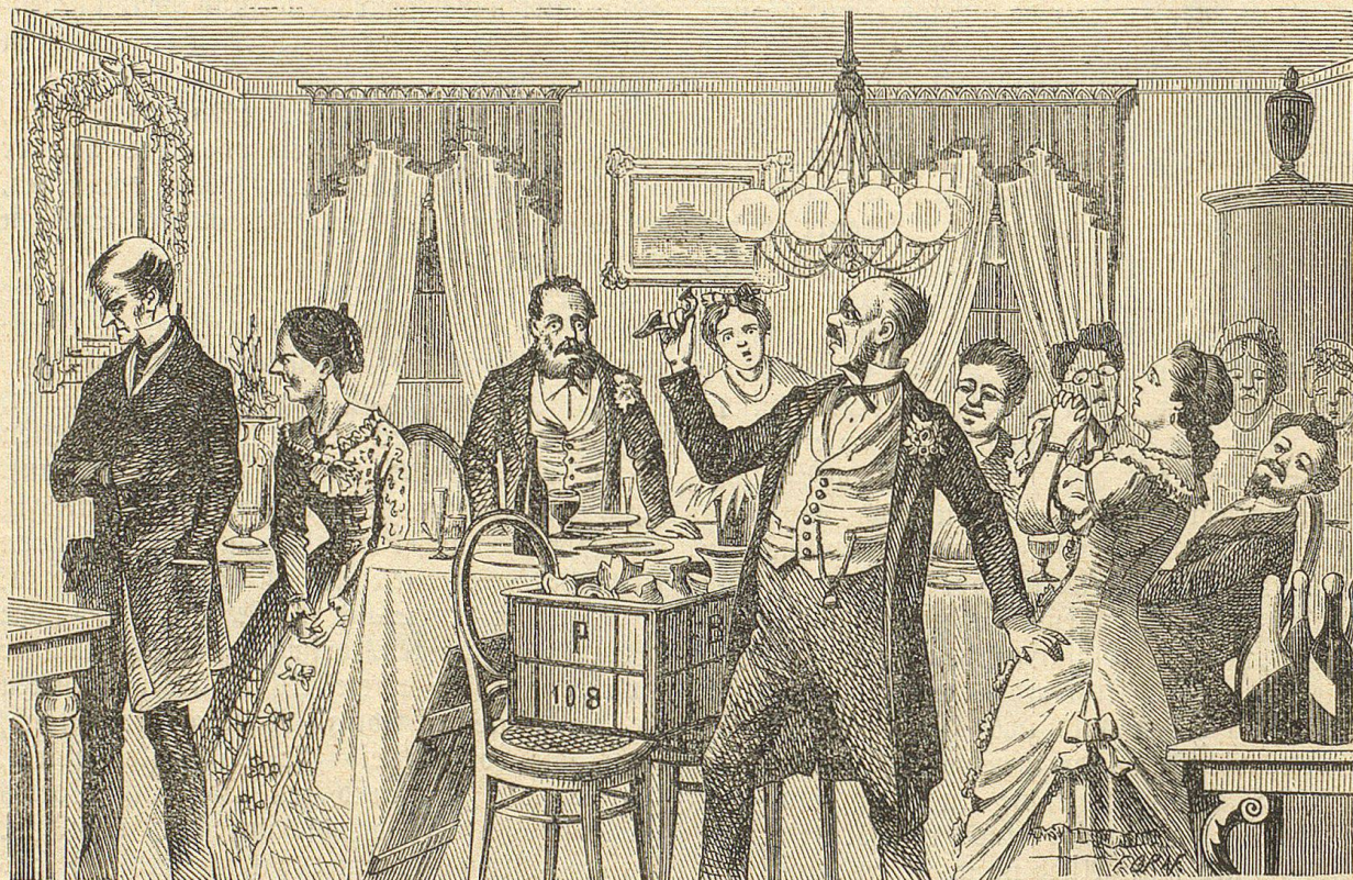
„Nu, das ist aber saftig!“ rief Herr Schnabel plötzlich aus beim Dessnen eines Papiers.

Item, der frühere Lehrling war gerächt durch Samuel, und Adrian Kelling sucht noch heute