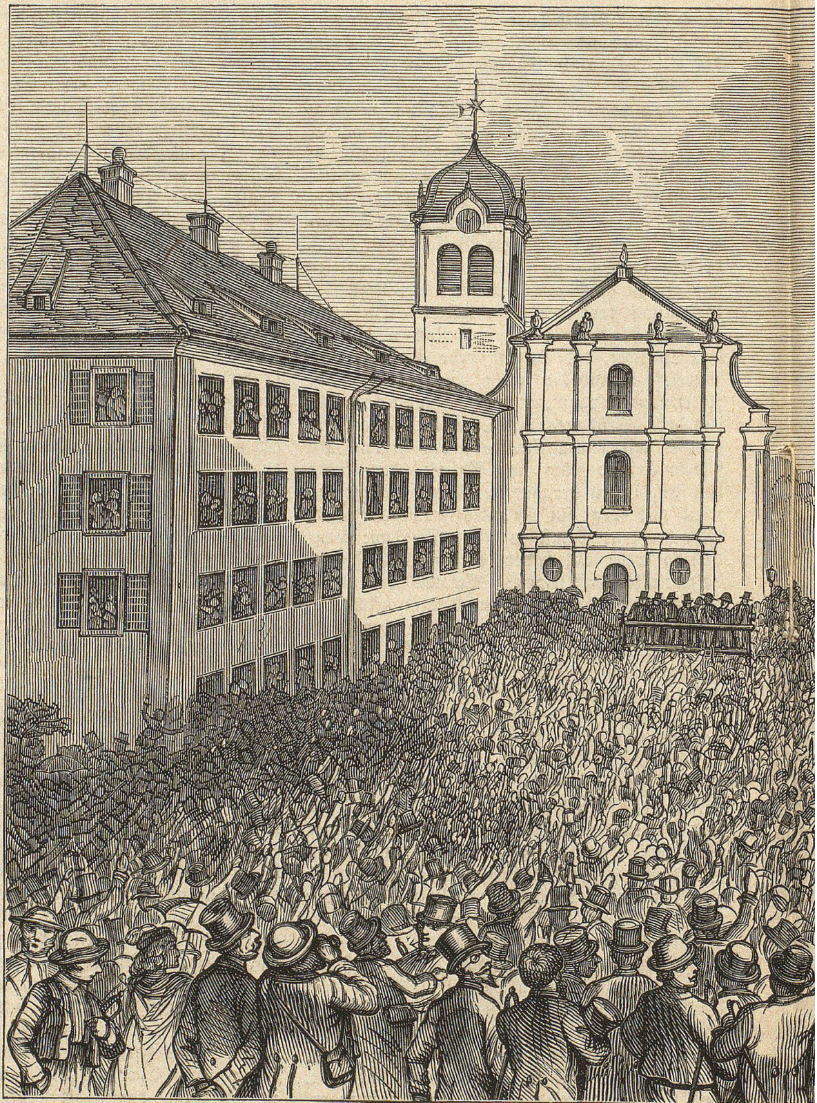
Gezeichnet von E. Rittmeyer in St. Gallen.