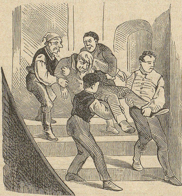
Vier Mann trugen ihn die Rathhaustreppe Herunter in den Arrest.

Raum hatte das Gepolter und Gekirre in der Amtsstube des Stadtschultheißen einer tiefen Stille Platz gemacht, als die ersten Böllerschüsse ertönten und alle Glocken zu läuten begannen; der Stadtschütz hörte von dem nichts, er schloß den Schlaf des Gerechten. Er hörte auch nichts davon, daß es auf dem Markt immer lauter wurde, daß man endlich die Rathhaustreppe heraufkam, daß der Saal sich mit Menschen anfüllte und daß verschiedene Versuche gemacht wurden, die verriegelte Thüre zu öffnen. Der König war präcis zu der bestimmten Stunde, um 5 Uhr, angelangt; die Uhren in B. zeigten zwar schon ein Viertel auf Sechs, das kam aber bloß daher, daß sie aus lauter Freude eine Viertelstunde vorgelaufen waren. Nach dem ersten kurzen Empfang vor der Stadt