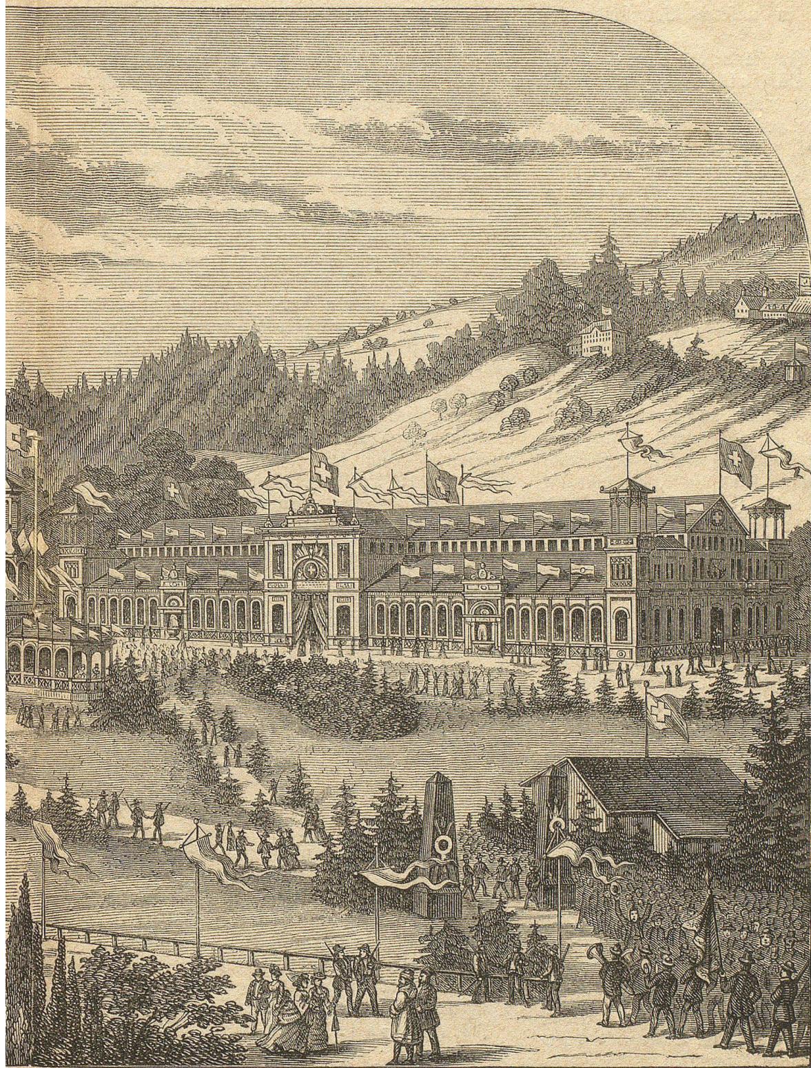
Exposition nationale en fest in St. Gallen. 1874.