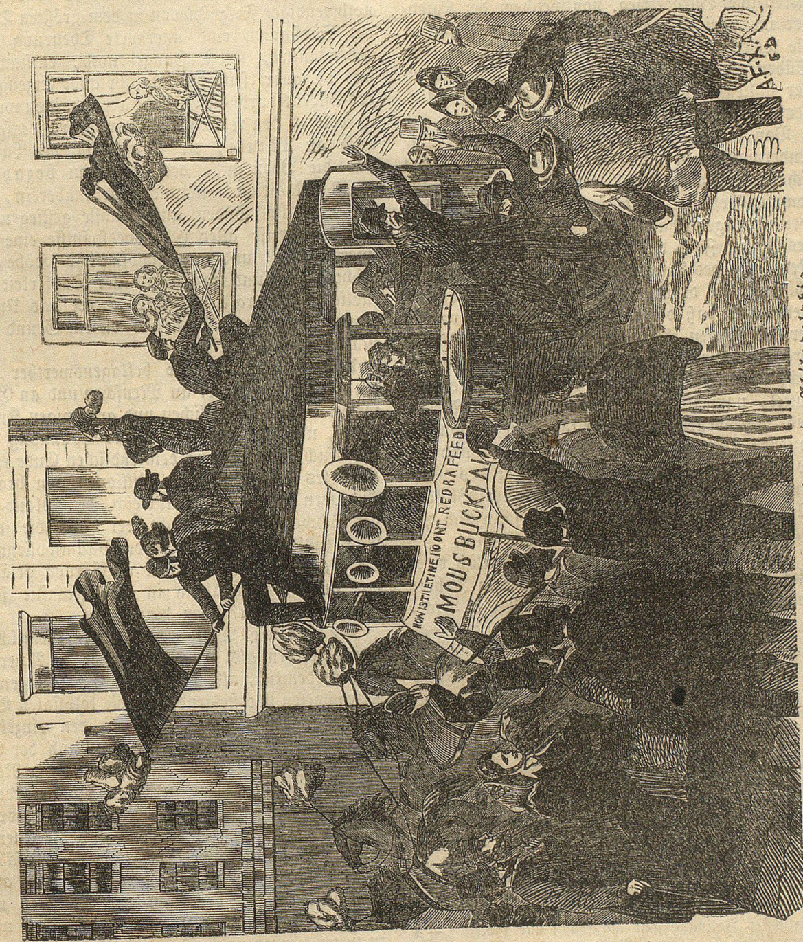
Die Truppenwerbung in Philadelphia.