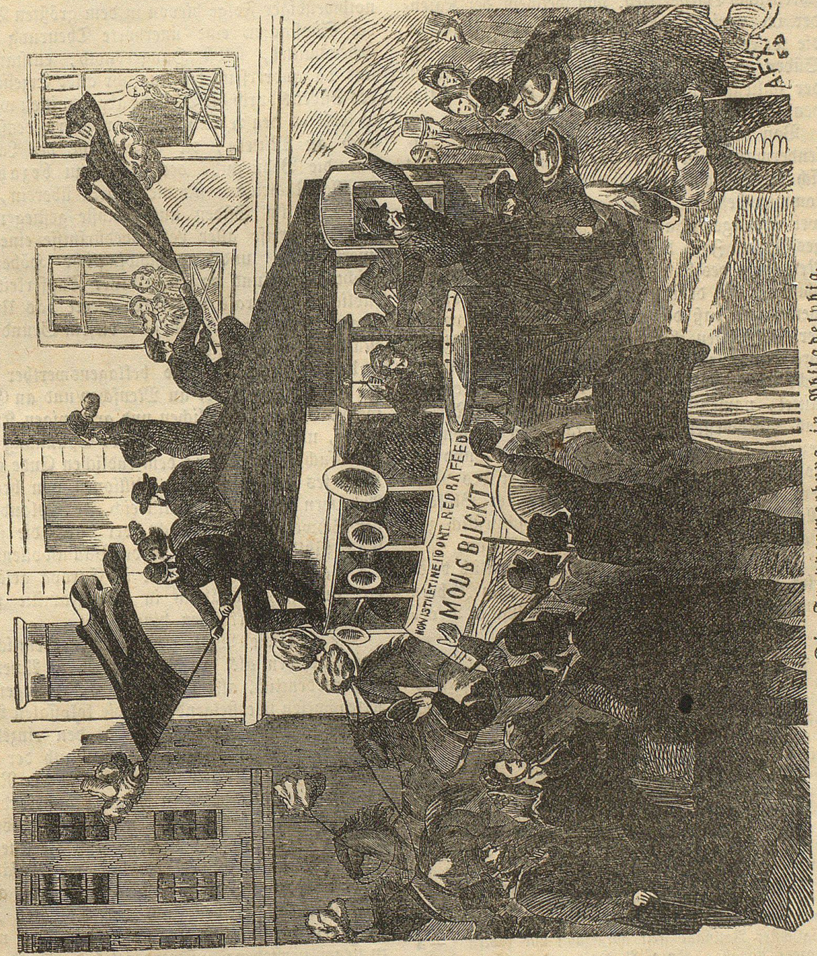
Die Truppenwerbung in Philadelphia.