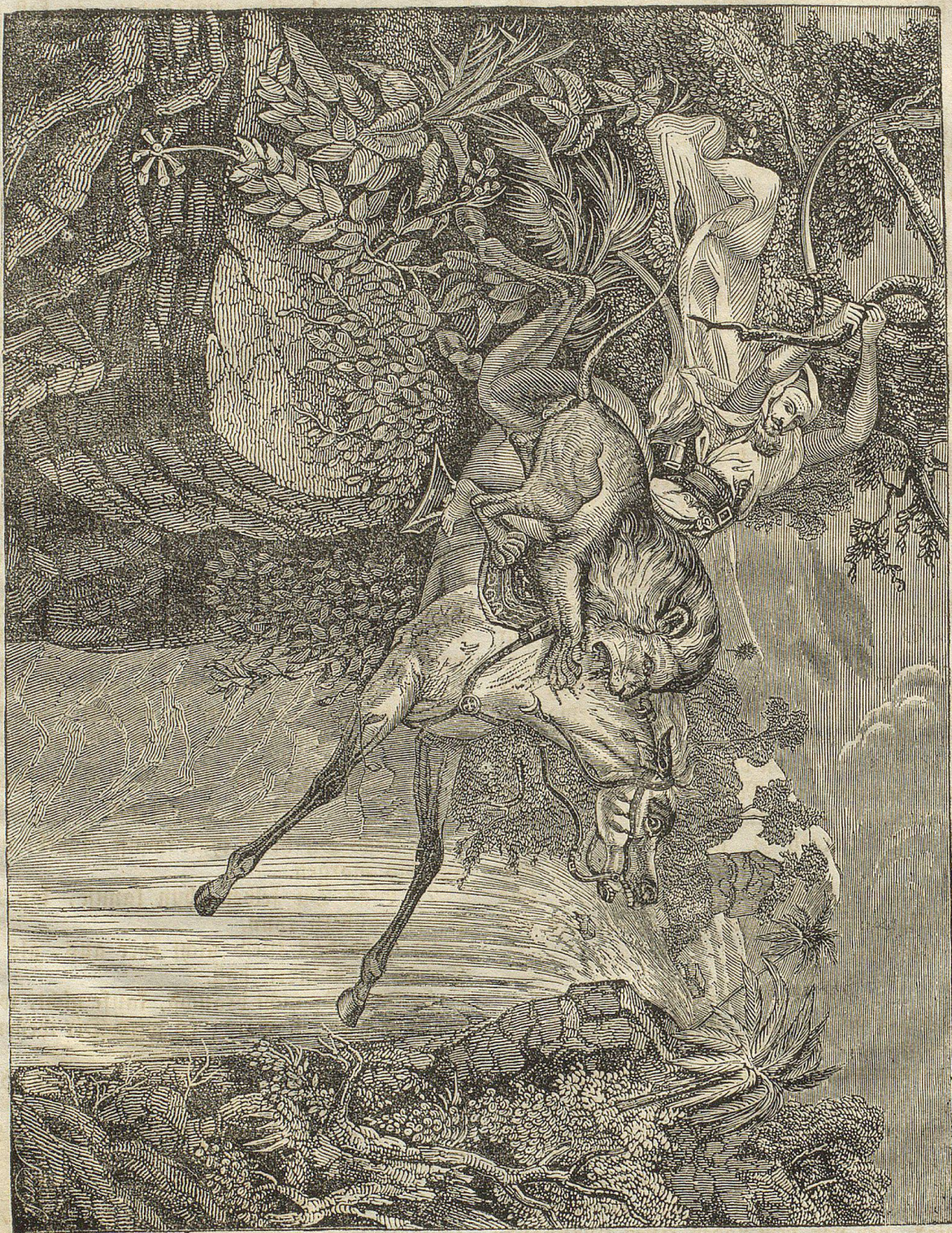
Der Sturz des Löwen.