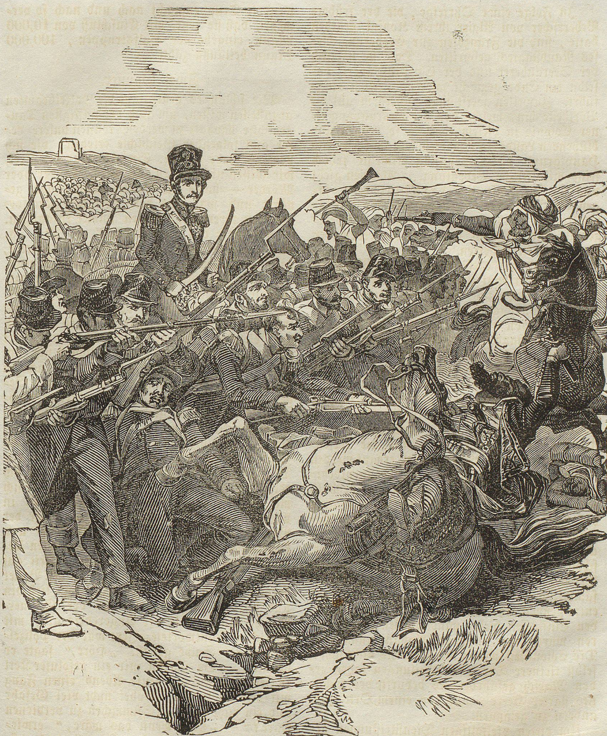
Gefecht mit Arabern in Algerien.