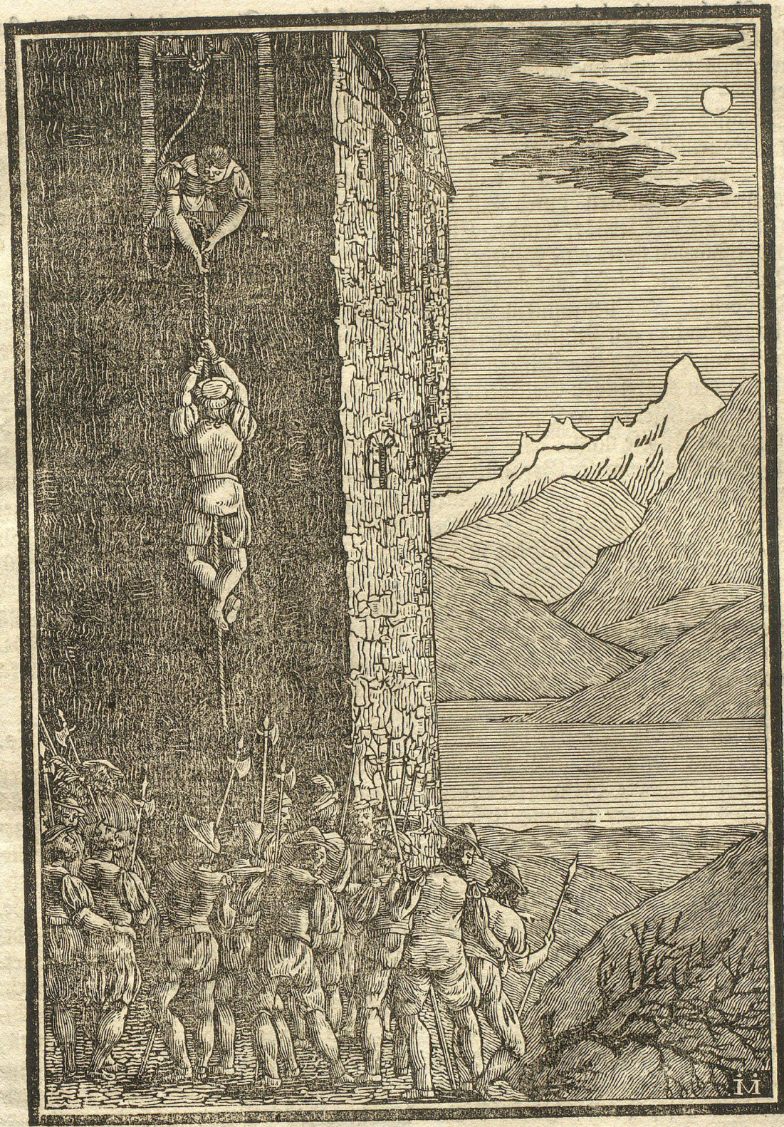
Die Eroberung von Rosberg.