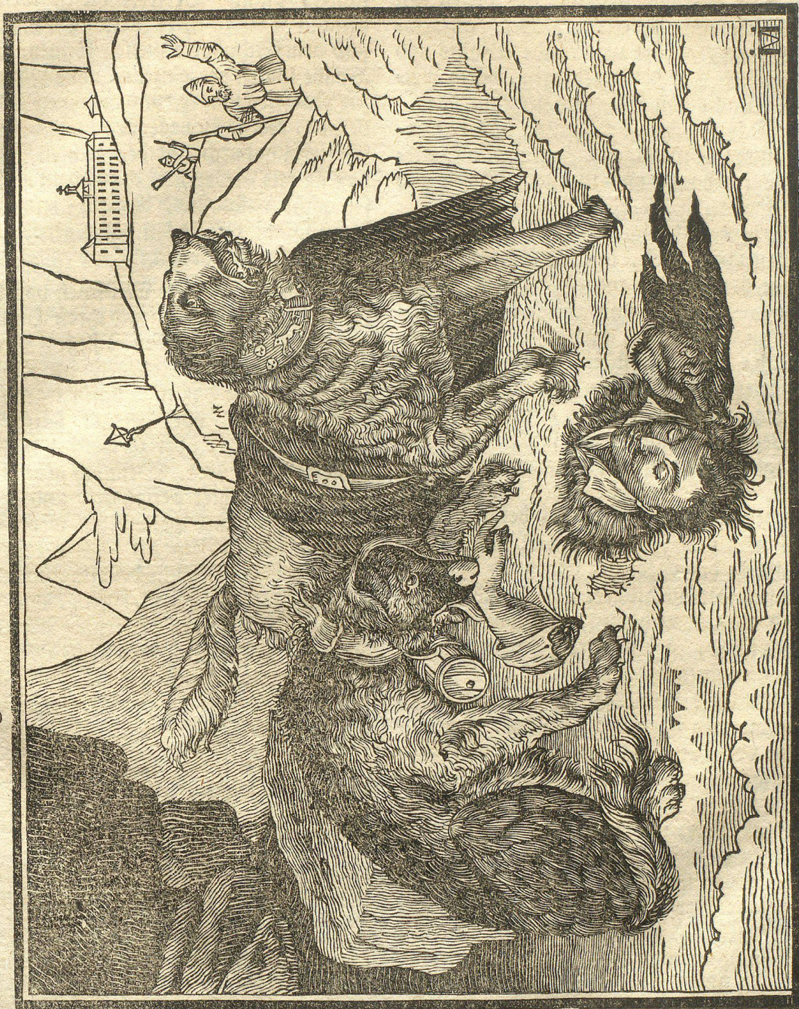
Die Hunde auf dem Bernhardsberge.