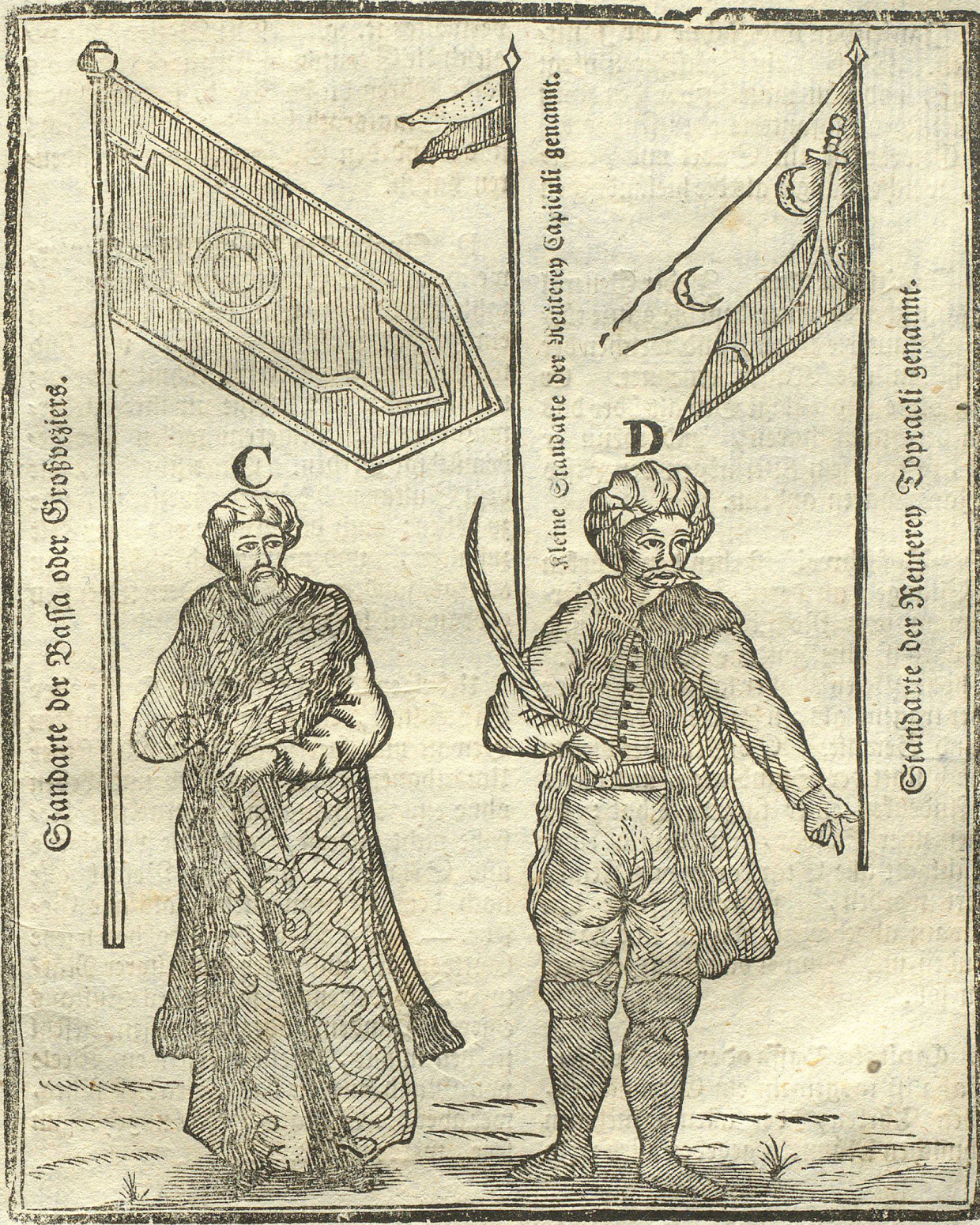
Standarte der Basha oder Großveziers.