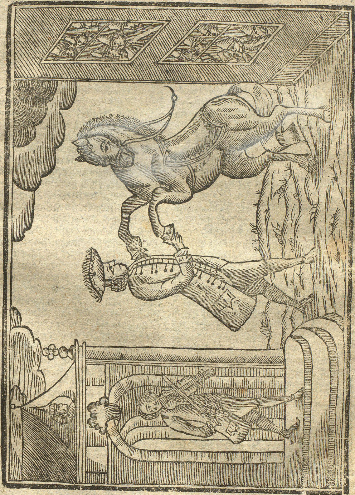
Abbildung eines wohl abgerichteten Tanz-Pferdes.